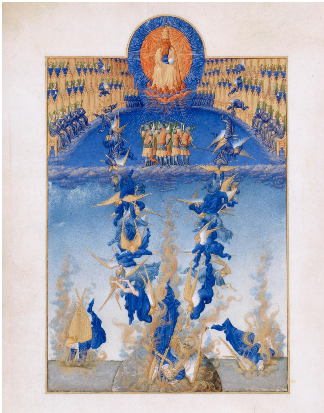
Figura 3 - Paul, Jean e Herman de Limbourg. A Queda dos Anjos Rebeldes. Les Très Riches Heures du Duc de Berry , 1413, Musée Condé, Chantilly, ms. 65, f. 64v.