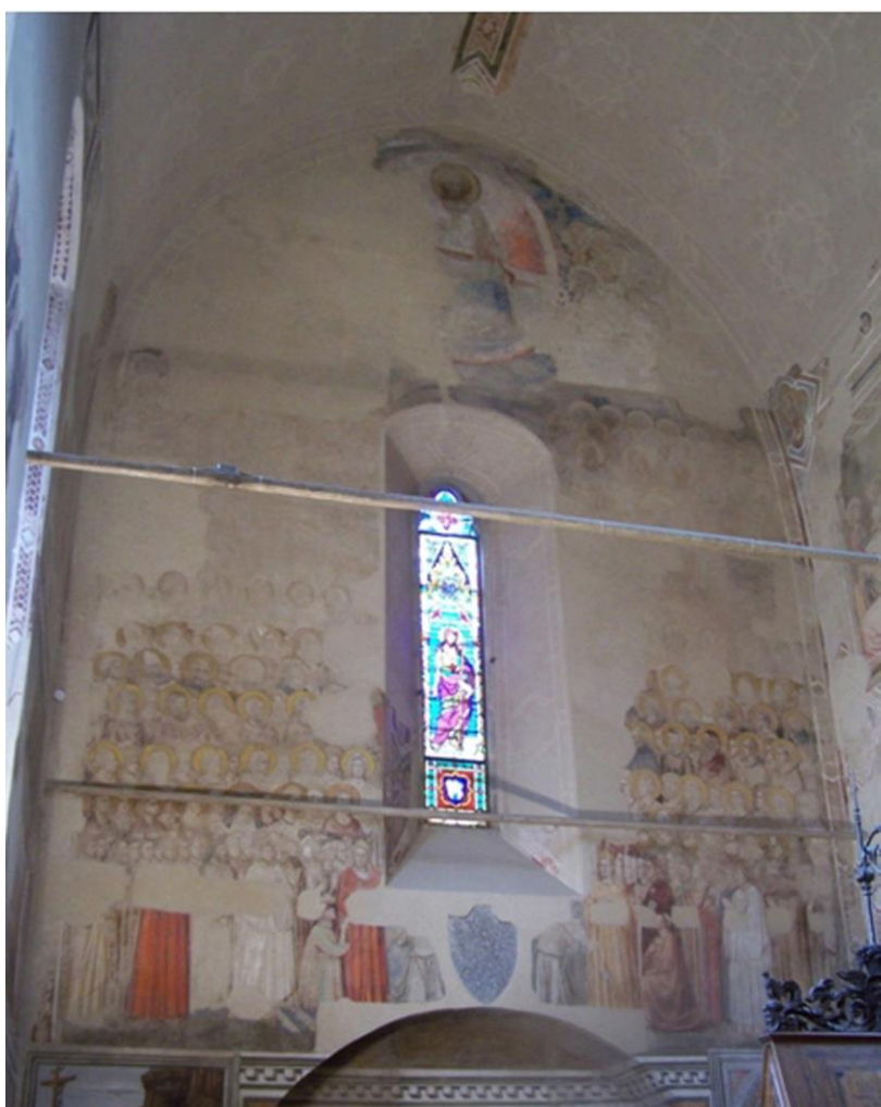
Figura 1 – Giotto e seguidores. Paraíso . Capela da Madalena (ou del Podestà ), Palazzo del Bargello, Florença, ca. 1336-1337.