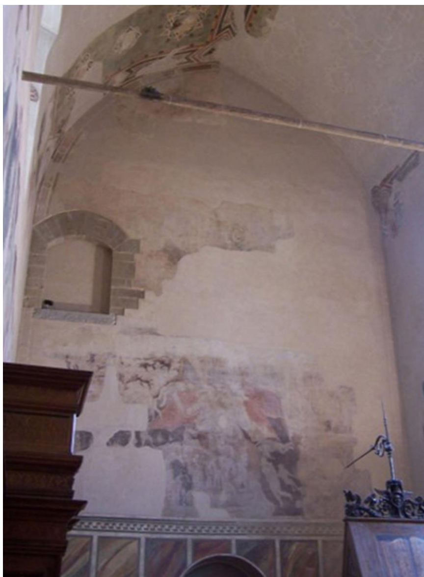
Figura 2 – Giotto e seguidores. Juízo Final . Capela da Madalena (ou del Podestà ), Palazzo del Bargello, Florença, ca. 1336-1337.