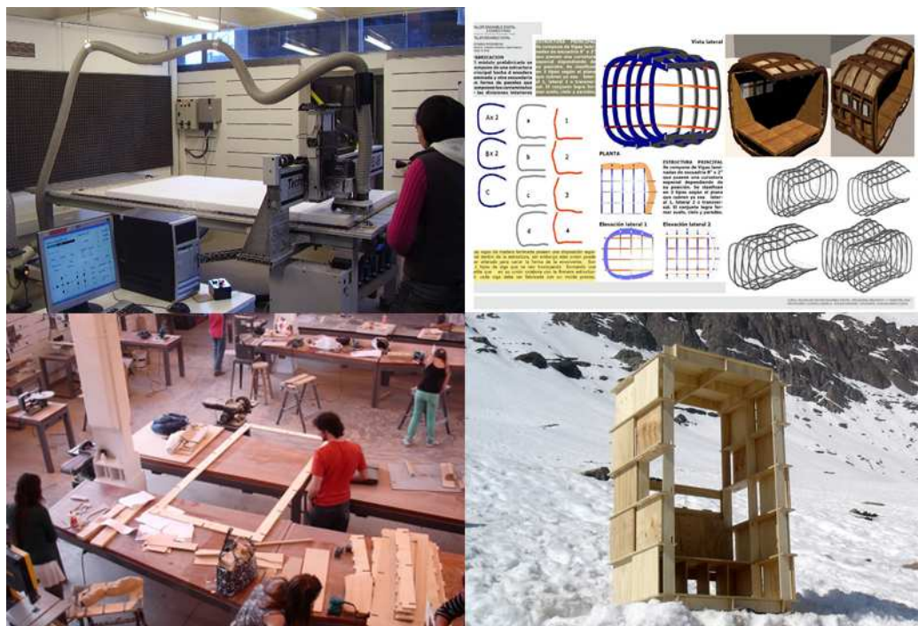
Figura 1. Taller Ensamble Digital (PUC, Chile, 2007-2008).

La experiencia más extensa fue el "Taller de Ensamble Digital" realizado en la Escuela de Arquitectura de la Pontificia Universidad Católica de Chile, en cuatro oportunidades (primer y segundo semestre 2007, primer y segundo semestre 2008). Con aproximadamente 15 estudiantes de cuarto o quinto año cada vez, en quince semanas de duración con dos tardes de trabajo a la semana (aprox. 240 hrs. totales). Se abordó la prefabricación y manufactura digital, desarrollando como temas de cada semestre; un sistema constructivo, una ampliación de vivienda, un habitat mínimo o un refugio de montaña. Se realizó análisis de referencias, diseño y modelación digital, y fabricación de prototipos utilizando el laboratorio de producción digital de la PUC, que posee cortadoras láser, enrutadoras e impresoras 3D.