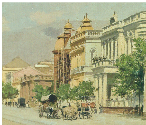
Figura 3. Alberto Orrego Luco, “Tarde en la Alameda” (detalle), c.1895. Colección particular Figure 3. Alberto Orrego Luco’s painting, “Tarde en la Alameda” (detail), 1895. Private collection.