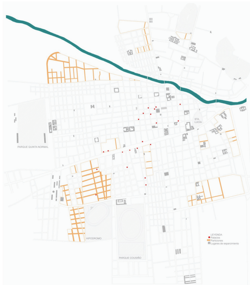
Figura 5. Plano síntesis que destaca los palacios con relación a los espacios de uso público y la Alameda (1860-1920).

Con esta secuencia de imágenes se demuestra que la edificación del palacio Vergara (como sus pares anteriores) marcó un hito social en un Santiago que parecía “despegarse” cada vez más del colonialismo español, porque mostró formas arquitectónicas inéditas y complejas para el entorno, en una ciudad dependiente económica y culturalmente, que aspiraba a transformarse en una urbe a lo europeo. Por cierto, es un ejemplo varias veces repetido