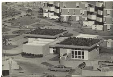
Fig.3. Cubiertas Jardín en Círculos Infantiles. Reparto Camilo Cienfuegos. La Habana

En 1961, se culmina el Reparto Camilo Cienfuegos como parte de la expansión de la capital hacia la zona este de la bahía. Con un carácter social se construyen los Círculos Infantiles de esta área, en los cuales se ejecutaron como estructuras de cierre superior cubiertas jardines. (Fig 3)