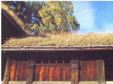
Fig.2. Casa tradicional de turba en Finlandia.

Durante la Edad Media y el Renacimiento en Europa, figuraron ejemplos muchos más modestos, donde se utilizaba turba en los techados y en las paredes para evitar fugas de temperaturas. Se puede afirmar que los países que cuentan con una tradición de cubiertas con turba o césped son: Suecia, Finlandia, Islandia, Dinamarca, Noruega y Groenlandia. (Rosa, 2015) Fig.2