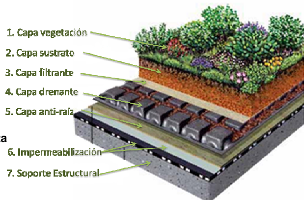
Fig.7. Elementos que componen una cubierta naturada.

Las cubiertas naturadas se encuentran compuestas por varias capas en las que a su vez se pueden encontrar distintos materiales en dependencia de su función. Estos materiales al igual que las capas pueden variar en dependencia del diseño y la ubicación de dicha cubierta. (Fig 7)