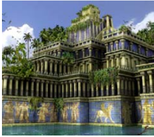
Fig.1. Jardines colgantes de Babilonia.

Luego de una revisión bibliográfica en el tema de referencia, se puede constatar que los antecedentes de las cubiertas naturadas, se remontan a los antiguos Jardines Colgantes de Babilonia. Construidos en el 600 a. c, son considerados por diversos autores como uno de los primeros exponentes de esta tipología. Aunque no se registran restos arqueológicos, se conoce de su existencia gracias a las descripciones de antiguos historiadores, donde se identifica una siembra de vegetación en relleno de tierra sobre estructura portante. (Montero, 2011). (Fig.1).