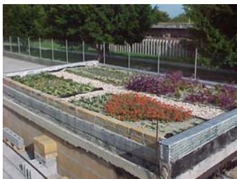
Fig. 5 Distribución de las plantas Año 2003.

Un ejemplo que encamina la experimentación del tema de estudio en el país es la cubierta prototipo del ISPJAE, concebido originalmente en el 2003. Se diseñó y ejecutó, en cuatro cuadrantes con una superposición de capas de distintos materiales. La selección de dichos componentes se realizó bajo la base de la adaptabilidad, funcionabilidad y el factor económico. (Calderín, 2003) (Fig.5)