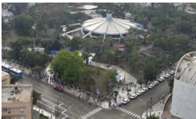
Fig.4. Heladería Coppelía.

La heladería Coppelía diseñada por el arquitecto Mario Girona, en 1966, fue concebida con cubiertas jardín en una de sus áreas laterales. En visita realizada al centro se pudo verificar por la autora que, aún sin el mantenimiento requerido, las especies de vegetación se mantienen fuertes, así como se conserva el sustrato. (Fig 4)