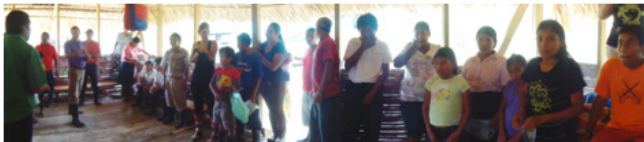
Figura 2. Reunión con la comunidad de Alto Urén, Talamanca, 2011.

El contexto universitario se circunscribió, por mucho tiempo, al espacio áulico, dejando de lado muchos otros escenarios que ofrecen opciones muy variadas para la formación del estudiantado, las cuales correctamente implementadas pueden ayudar a lograr el éxito en la educación superior, en ese sentido, el Ministerio de Educación de Ciencia y Tecnología [MECT] y la Organización de los Estados Americanos, Agencia Internacional para la Cooperación y el Desarrollo [OEA-AICD] (2005) , afirman que: