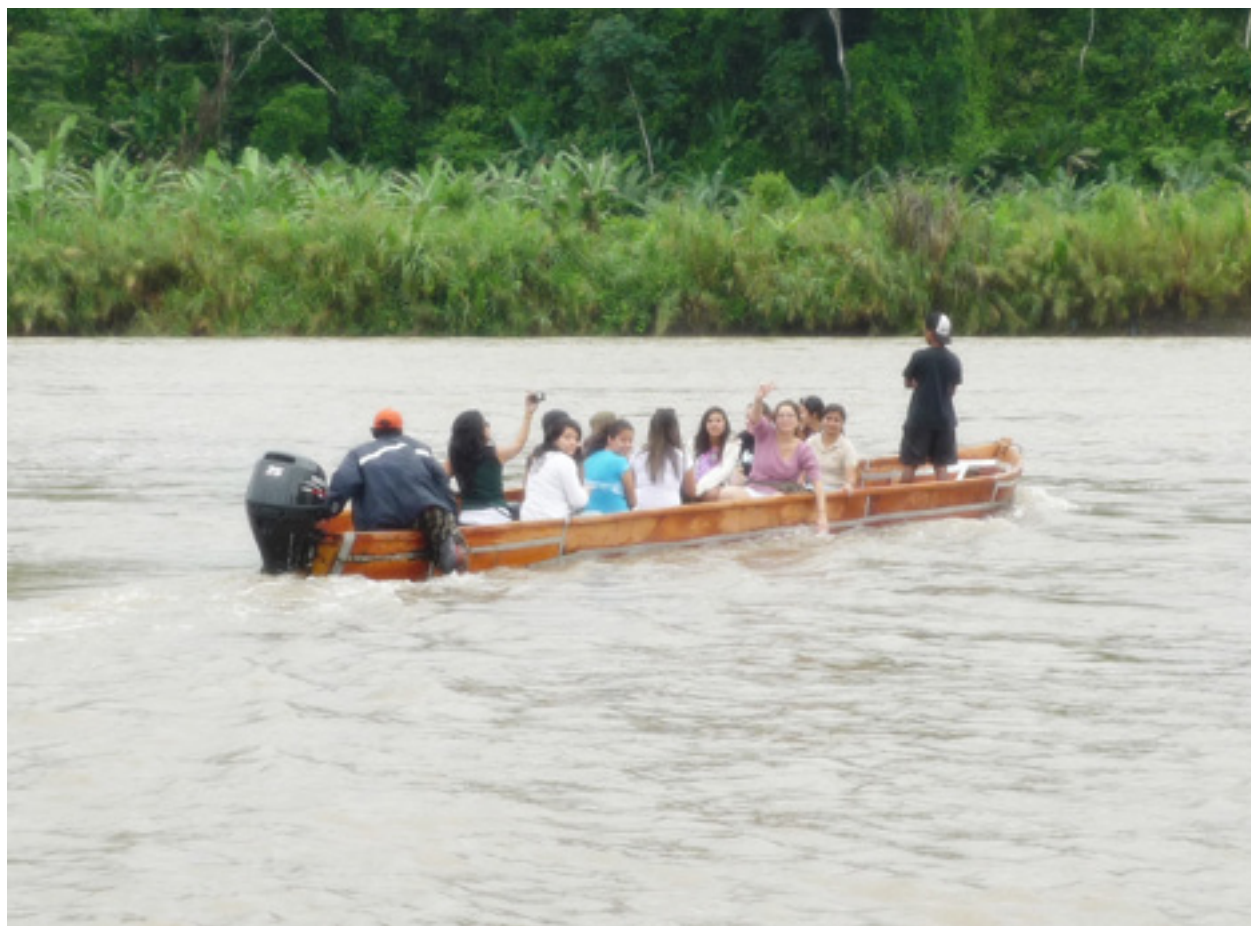
Figura 3. Estudiantes cruzando el río Telire, Talamanca, 2011.

y otras actitudes a través de los diferentes cursos que se imparten en un plan de estudios (ver figura 3), y que contribuyen a la búsqueda de la calidad, entendiéndola, tal como lo cita Muñoz (2005), como: “la calidad no se reduce a un criterio de eficiencia cuantificable, sino que abarca la profundidad del compromiso humano hacia el presente y el futuro de todas las personas” (p. 27), sobre todo si se habla de la formación de personal formador, el cual, posteriormente, será el encargado de guiar los procesos de enseñanza y aprendizaje de las nuevas generaciones. El mismo autor señala que: