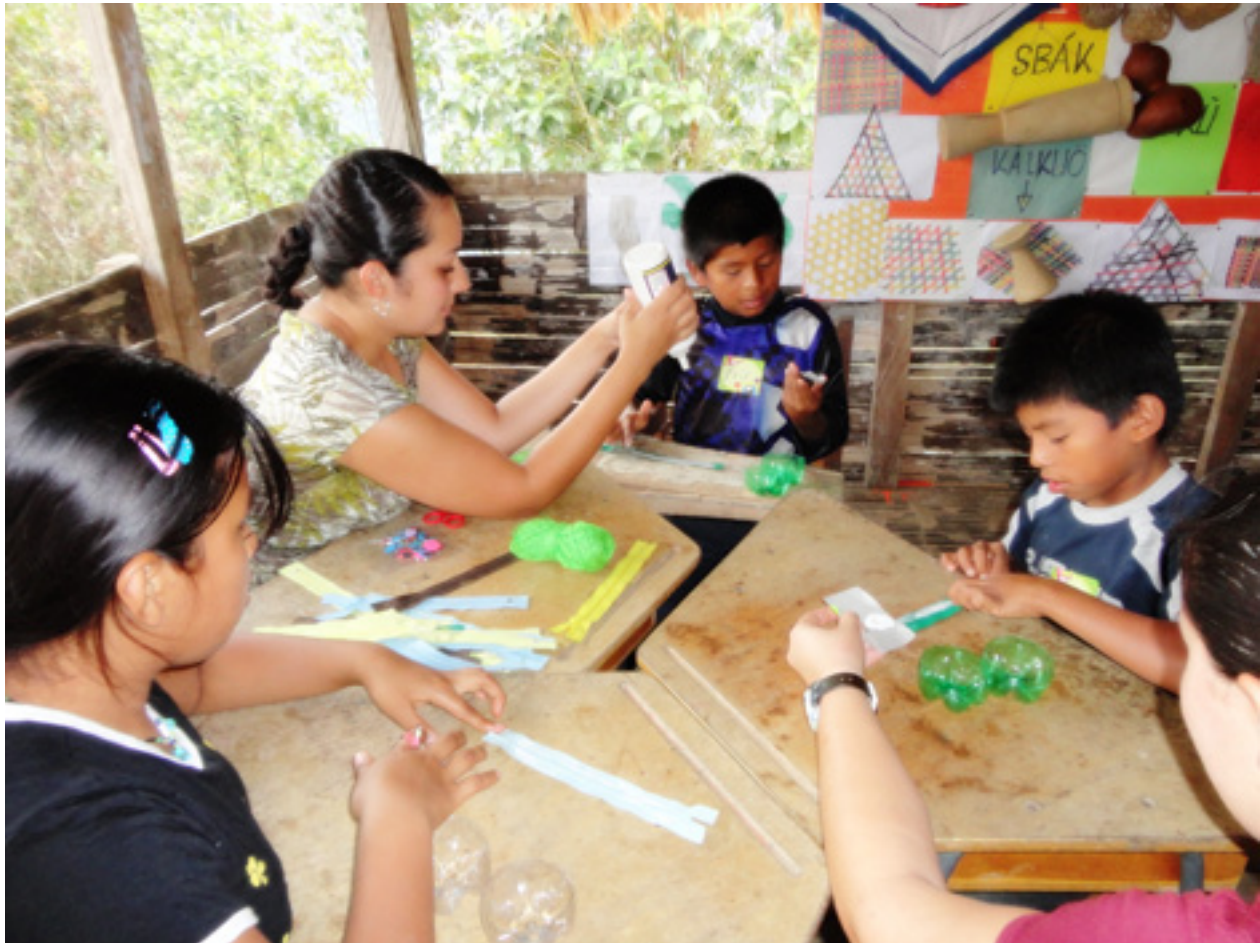
Figura 6. Talleres con estudiantes de la comunidad de Alto Urén, Talamanca, 2007.

En la misma línea, Rodríguez y Forero (2011) , comparten que “viajar implica anticiparse, moverse, salir del sitio, emprender una acción; viajar reclama goce, disfrute, placer” y agregan lo siguiente: