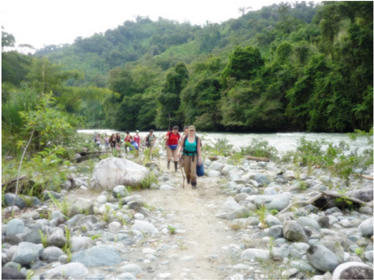
Figura 8. Kachabri, Talamanca, 2011.

Y aunque al final todos llegan al mismo lugar, el recorrido y transformación del individuo es único, cada persona descubrirá lo que estaba destinado a descubrir, cada una tendrá una historia única que contar y se transformará en aquellas áreas donde era necesario que lo hiciera. El colectivo se conformará también en una entidad con características propias, que luego aportará a las partes un cúmulo de experiencias inolvidables, ya que no podemos ser sino lo que somos en relación con los demás y, durante las expediciones pedagógicas, es primordial el vínculo que se crea en el grupo y la dinámica que se forja conforme la experiencia se desarrolla.