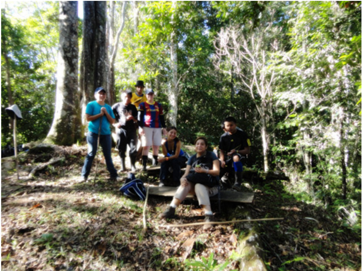
Figura 7. Alto Urén, Talamanca, 2011.

La idea de viaje invita a mirar a ser mirado a través de las experiencias del otro y de lo otro, es reconocer, recorrer, escudriñar, sorprenderse frente a lo que aparentemente se muestra como cotidiano, pero que en los ojos y en el sentir de los maestros expedicionarios adquiere otros sentidos. (p. 3)