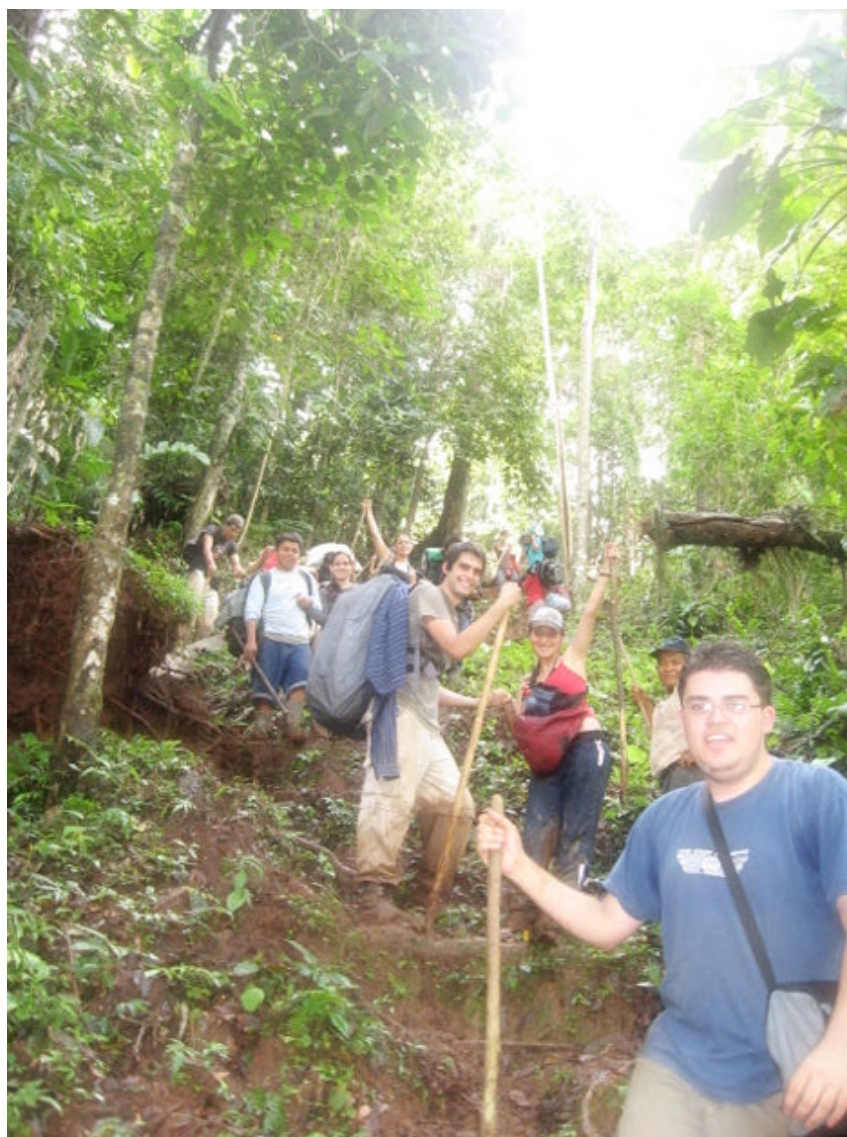
Figura 1. Expedición pedagógica. Talamanca 2007.

URL: http://www.una.ac.cr/educare CORREO: educare@una.cr