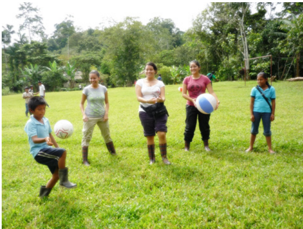
Figura 5. Talleres recreativos con estudiantes de la comunidad de Kachabri, Talamanca, 2011.

URL: http://www.una.ac.cr/educare CORREO: educare@una.cr