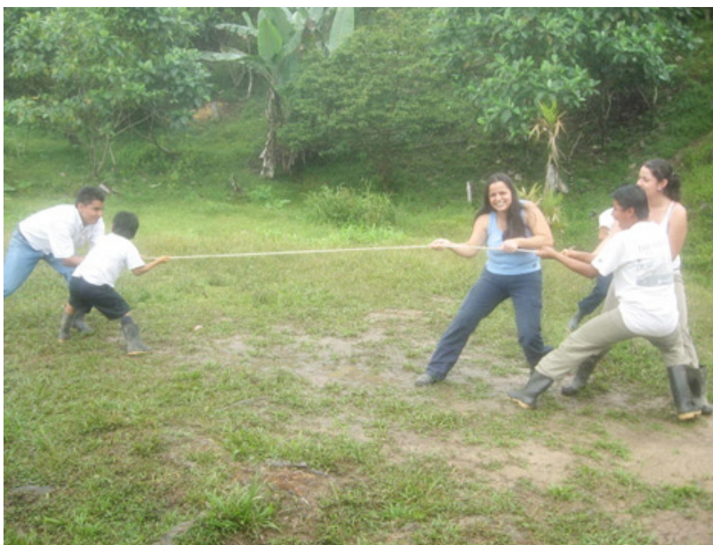
Figura 4. Talleres recreativos con estudiantes de la comunidad de Alto Urén, Talamanca, 2007.

Asumir el nuevo paradigma significa situarse en una pedagogía alternativa, en una biopedagogía del aprendizaje con visión cósmica que nos relaciona con la totalidad. En el paradigma emergente se concibe la educación como opción emancipadora y hay una ruptura con el concepto mecanicista del aprendizaje. (p. 19)