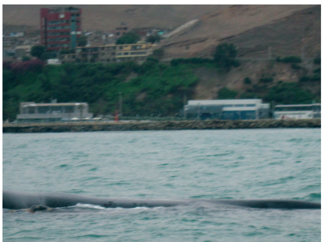
Figura 4. Par Madre-cría de ballena franca austral, registrado en la costa de Lima, Perú.