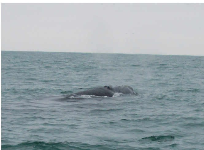
Figura 3. Madre y Cría de Eubalaena australis , registrada en la costa de Lima, Perú.