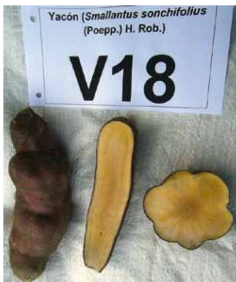
D14: Púrpura grisáceo claro D15: Naranja claro D16: Con hendiduras