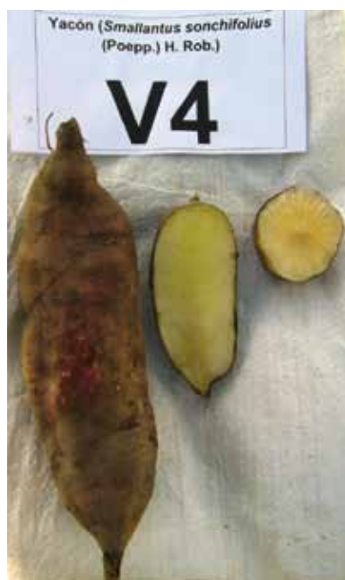
D14: Púrpura grisáceo oscuro D15: Amarillo naranja D16: Lisa