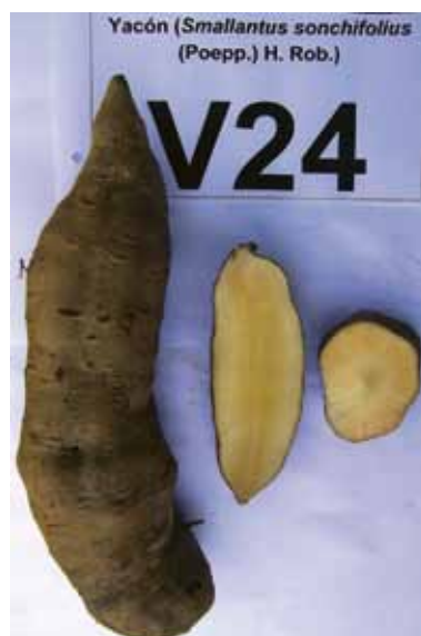
D14: Púrpura grisáceo oscuro D15: Amarillo naranja D16: Con hendiduras