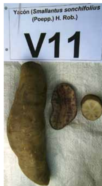
D14: Amarillo claro D15: Blanco amarillento con motas irregulares púrpura rojizo D16: Con hendiduras