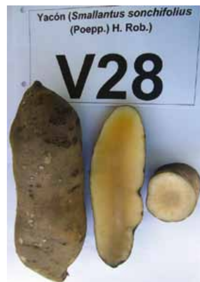
D14: Amarillo claro D15: Amarillo naranja D16: Lisa