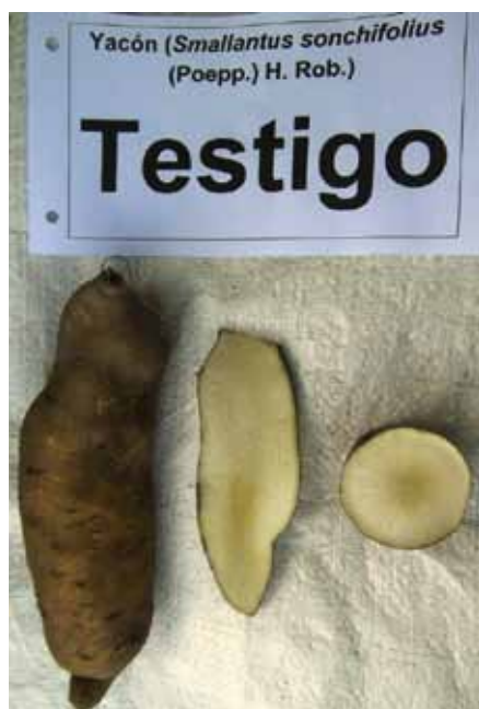
D14: Púrpura grisáceo claro D15: Blanco D16: Lisa

Anexo 1: Caracterización morfológica de las variedades de yacón empleadas como parentales para el Descriptor 14: Color de la superficie de la raíz reservante, Descriptor 15: Color de la pulpa de la raíz reservante y Descriptor 16: Tendencia a formar hendiduras en las raíces reservantes.