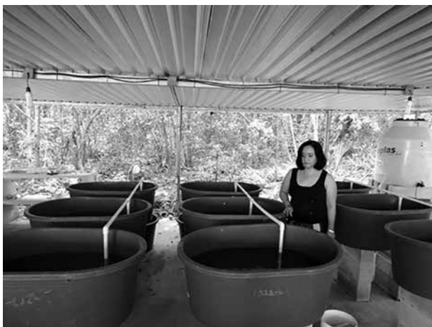
Figura 1. Área de cultivo de los caracoles Pomacea flagellata , para estudio de la preferencia de sustrato para la ovoposición de las huevas.

Los sustratos seleccionados fueron: raíces de mangle ( Rhizophora mangle ), tallos de carrizo ( Arundo donax ) y tubos de PVC (Fig.2). Los dos primeros son abundantes en la laguna de Bacalar, el ambiente natural de la chivita. Cuando una masa de huevo fue puesta en la pared de la tina, se registró como “pared”. Los sustratos se montaron en una base colocada en el centro de las tinas, cada uno tuvo una separación de 17 cm entre ellos, y una altura de 42 cm y los sustratos se distribuyeron de manera aleatoria en las bases (Fig.2). Los residuos de alimento y del metabolismo de los caracoles, se eliminaron por sifoneo cada dos días, restableciendo el volumen en cada tina. Los organis-