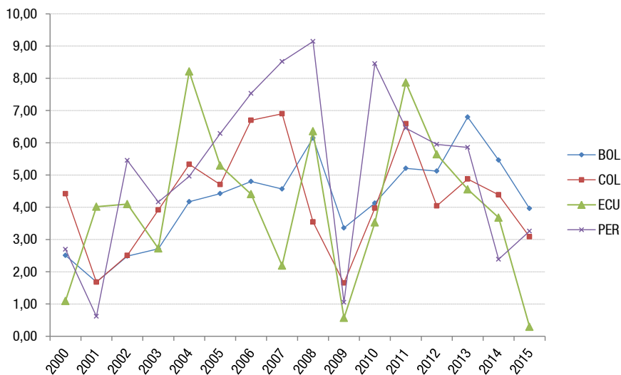
Figura 1. Tasa de crecimiento del PIB real de los países CAN, 2000-2015. Fuente: elaboración propia con datos del Banco Mundial.

cimiento positivas superiores al 5% anual desde el 2006 hasta el 2011, con excepción del 2009 donde alcanzó 1,5%. Sin embargo, durante los tres últimos años dicha tasa de crecimiento fue decreciente, para situarse alrededor de 4,0%. Es importante resaltar, que el comportamiento de las variables macroeconómicas de cada uno de los países andinos es muy divergentes, y marcadamente asimétricas entre sí (ver Figura 1).