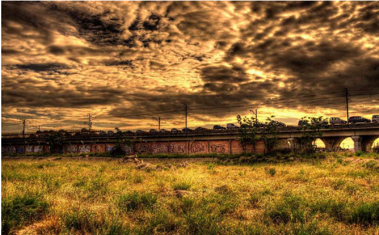
Figuras 2. Vacío Urbano de Zaragoza. Área 3.

"los cambios en la geografía y en la composición de la economía global produjeron una compleja dualidad: una organización de la actividad económica espacialmente dispersa, pero a la vez globalmente integrada" (Sassen, 1999:29).