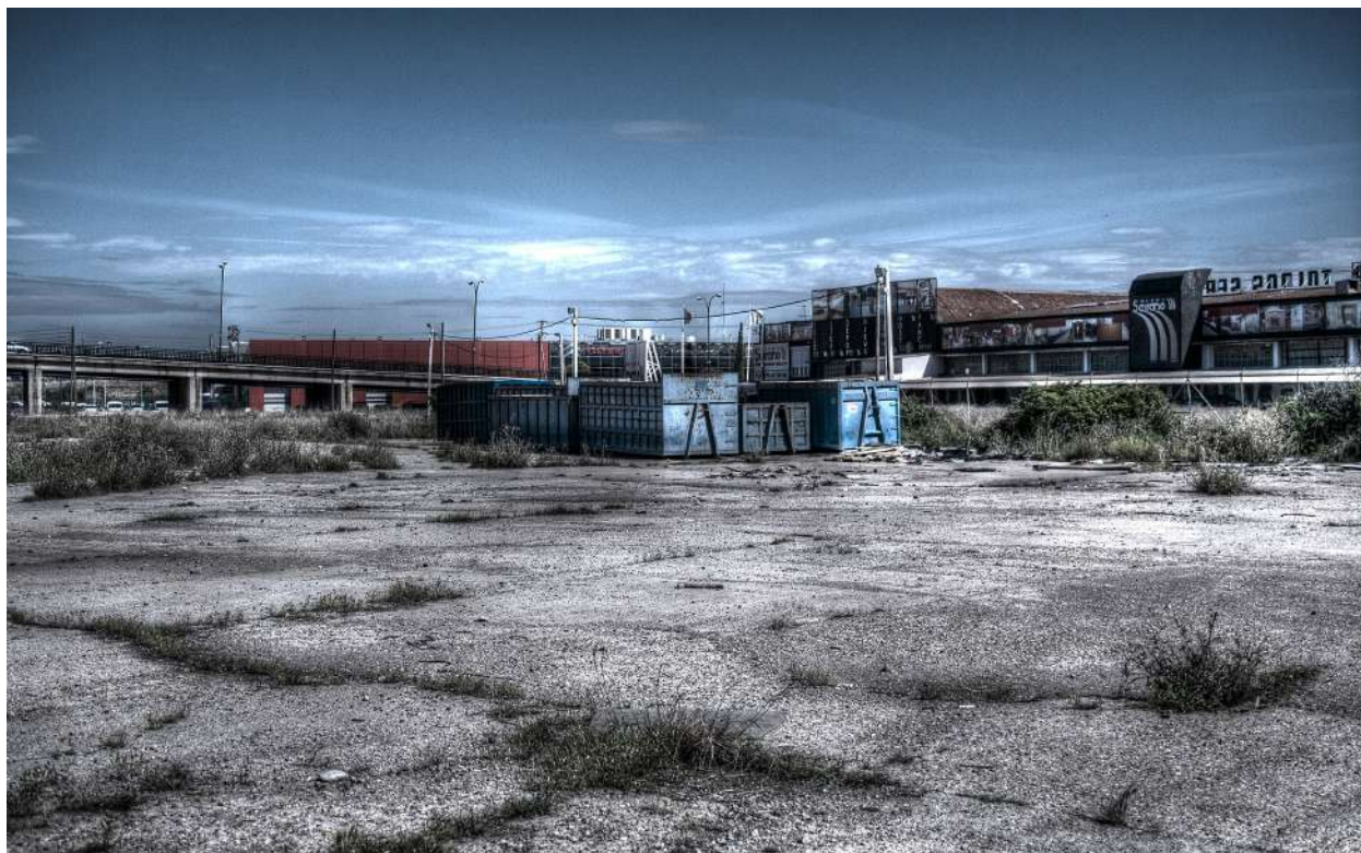
Figuras 1. Vacío Urbano de Zaragoza. Área 1.