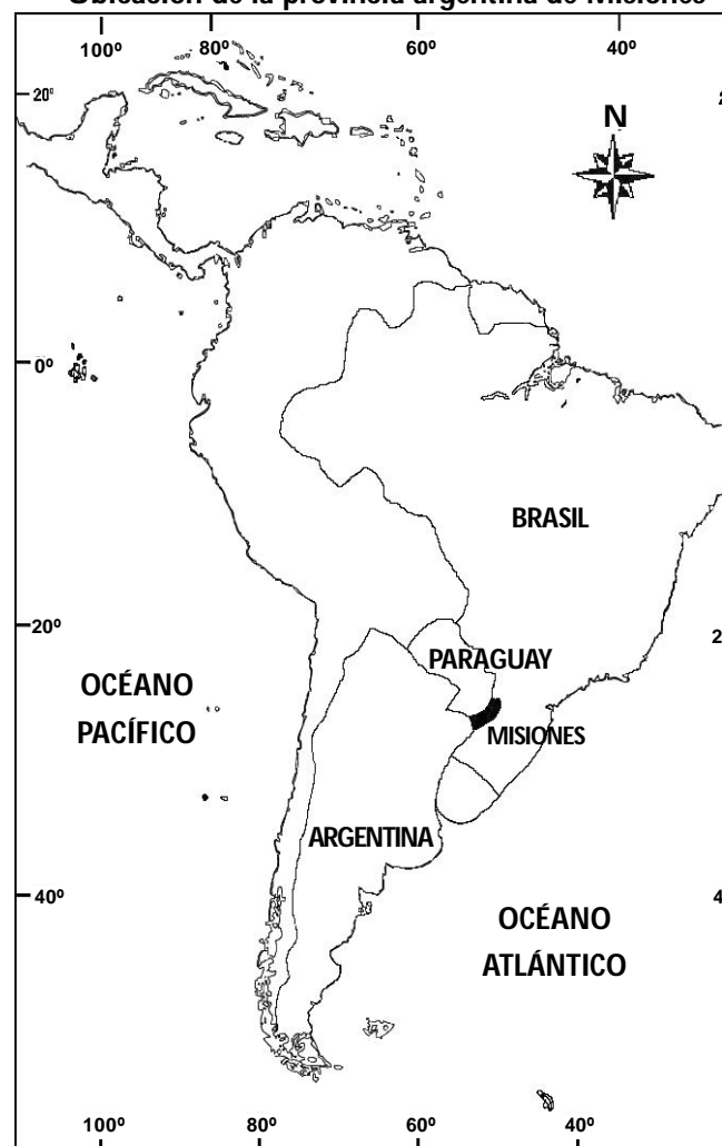
Mapa 1 Ubicación de la provincia argentina de Misiones