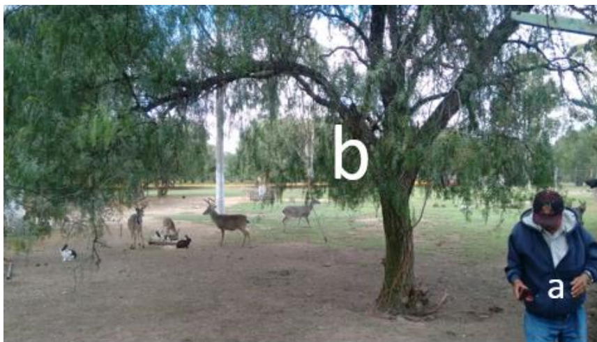
Imagen 1 Fotografía del Lic. Erick Osbaldo Oñate Ramírez

de iconicidad: el individuo (marcado con la letra a ) y su ambiente (marcado con la letra b ). Respondiendo tal representación a ambiente 1 .