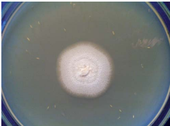
Figura 2 Colonia de Sporothrix pallida complex aislado de paciente con onicomiosis (PDA; 7 días de incubación a 30 °C).

Las distintas especies del complejo Sporothrix schenckii se aíslan principalmente en áreas geográficas tropicales y