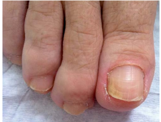
Figura 1 Uña del pie derecho de la paciente. Se observa cambio de coloración y engrosamiento subungueal del borde lateral.

Se obtuvieron 3 muestras en distintos tiempos por raspado subungueal del primer dedo del pie derecho mediante bisturí estéril (la paciente fue citada en 3 fechas distintas a lo largo de 45 días). El examen microscópico directo se realizó