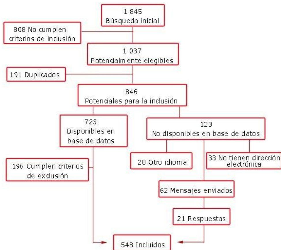
Fig. 1. Algoritmo de selección de artículos.