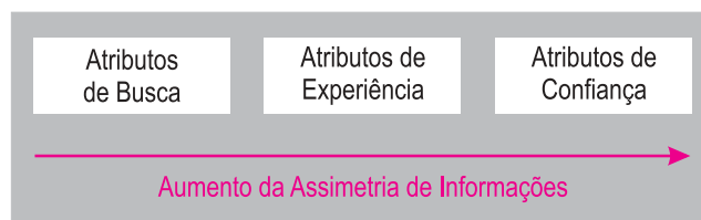
Figura 1: Tipos de Atributos

No ato da compra, dificilmente os consumidores têm conhecimento da qualidade da carne, pois, nesse momento, ela pode ser representada por uma série de atributos passíveis de ser identificados ou não. Nesse sentido, a figura 1 relaciona os tipos de atributos com a informação assimétrica entre o comprador e o fornecedor.