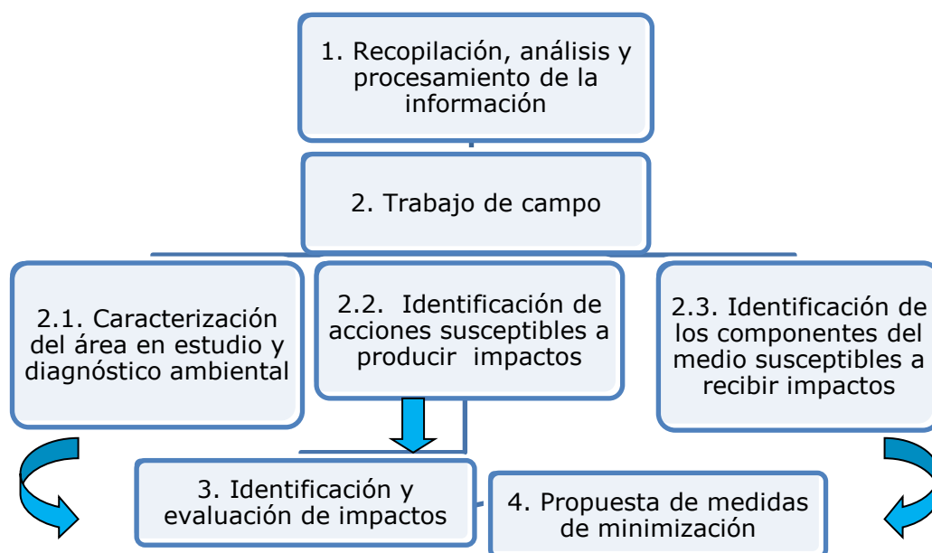
Figura 2. Etapas metodológicas de la investigación.

1. Recopilación, análisis y procesamiento de la información: Esta fase fue instituida a partir de la revisión sobre los antecedentes de la temática en estudio.