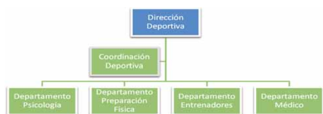
Figura 2. Organigrama deportivo del Fútbol Base del Club Atlético de Madrid

Para ello, realizamos una labor de psicólogo de “chándal” (Roffé, 2007), tanto desde la utilización de indumentaria deportiva (hemos observado una mayor integración en el ámbito frente a otros momentos que no la utilizábamos), como de la observación y recogida de información real del comportamiento del deportista desde los entrenamientos y las competiciones (García-Naveira, 2010). Partiendo de la elaboración de diseños observacionales (Anguera, Blanco, Hernández y Losada, 2011), los datos recogidos representan un material de trabajo dentro del programa de intervención, asesoramiento y orientación de las personas implicadas (Ortega, Cárdenas, Puigcerver y Méndez, 2005).