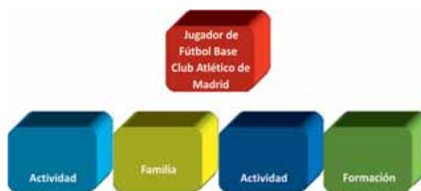
Figura 1. Áreas del Programa Integral Deportivo (PID)

El PID está constituido por una metodología de trabajo centrada en cuatro áreas: 1) la actividad deportiva, 2) la familia y relaciones sociales, 3) la actividad académica y 4) la formación y educación (ver Figura 1). Cada una de estas áreas posee unos responsables y gestores (padres, colegios, entrenadores...), aunque es el propio club quien los lidera a través del Departamento de Psicología (comunicar, coordinar, incentivar...). Entendemos que estos pilares, son la base de un futuro prometedora tanto personal como deportivo.