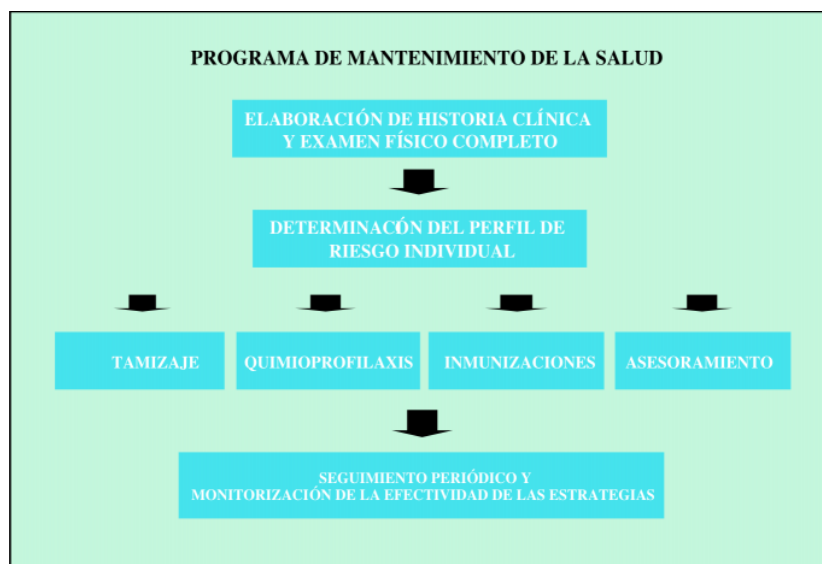
Figura 2. Actividades individuales del programa de mantenimiento de la salud.

Si bien muchas de las acciones propuestas para cada persona ten-