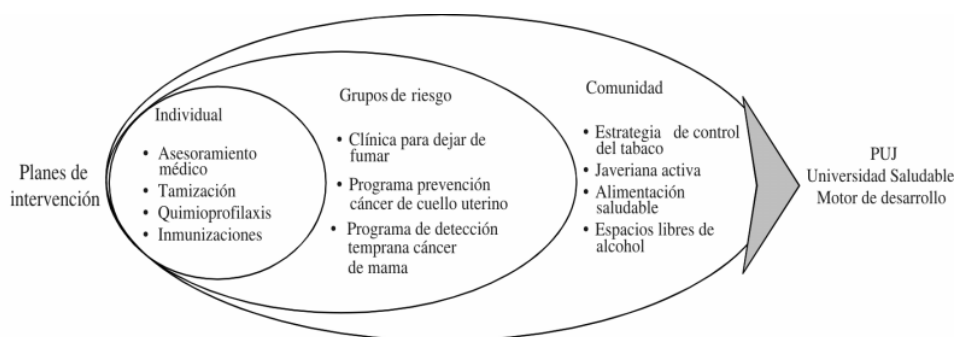
Figura 3. Planes de intervención del programa de mantenimiento de la salud.

activa , organizado por el Centro de Formación Deportiva), la asesoría nutricional permanente brindada por el Centro de Orientación Nutricional de la Facultad de Ciencias, el mejoramiento de la oferta de alimentos saludables en el campus y la creación de escenarios de esparcimiento que desestimen la ingestión de alcohol ( Terraza coctel ). Además, muchas de las acciones generales se han ofrecido a la comunidad a través de una estrategia denominada Semanas de la vida saludable , iniciativa encaminada a reunir todas las actividades favorecedoras de la salud, organizadas por distintas instancias de la universidad. Igualmente, como parte de esta estrategia están disponibles actividades del programa de mantenimiento de la salud que pueden ofrecerse globalmente (inmunizaciones, detección temprana de hipertensión arterial, sobrepeso y obesidad, cáncer de cuello uterino, etc.) (figura 3).