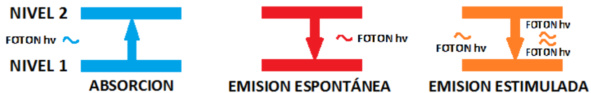
FIGURA 3 PROCESOS DE ABSORCIÓN – EMISIÓN DESCRITOS POR EINSTEIN EN 1916

La emisión estimulada se define como el proceso por el cual los haces de luz láser son producidos dentro de la cavidad láser. Este fenómeno se describe a partir de la teoría de Albert Einstein de cuerpo negro en 1916, en la cual describe la transcripción espontánea de fotones desde las teorías de Max Planck y Niels Bohr, donde la energía se irradia como fotones en una onda coherente; así la emisión hace que el haz de luz se expanda/amplifique geoméricamente, dando la posibilidad de cuantificar la energía (6, 7,14). Einstein propone que en este intercambio de electrones entre el exterior y el átomo pueden existir dos procesos: absorción o emisión. A su vez, dentro de los procesos de emisión existen dos fenómenos: emisión espontánea (emisión de un fotón a partir de la desestimulación espontánea del átomo) y emisión estimulada (emisión de dos fotones similares a partir de un fotón incidente). Esta última clase de emisión es el principio físico del láser (2, 4,10) (figura 3).