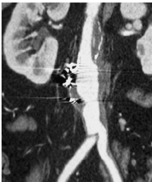
Figura 3 - Caso 2: angiotomografia com aneurisma anastomótico de aorta abdominal infra-renal

Foi realizada correção endovascular do pseudo-aneurisma, utilizando-se uma endoprótese tubular aórtica posicionada justa-renal até a bifurcação do enxerto, também por via femoral. O paciente se encontra com 3 meses de pós-operatório, com evolução satisfatória (Figuras 4 e 5).