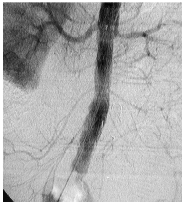
Figura 5 - Caso 2: arteriografia intra-operatória após correção endovascular com prótese tubular aórtica e exclusão do aneurisma (a prótese está posicionada entre as artérias renais e artérias ilíacas comuns)