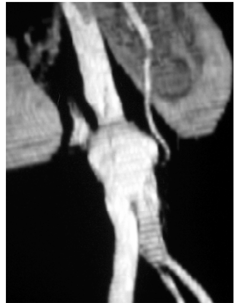
Figura 1 - Caso 1: angiotomografia evidenciando aneurisma anastomótico de aorta abdominal infra-renal

Paciente do sexo masculino, 57 anos, obeso, hipertenso. Tratado cirurgicamente de doença oclu-