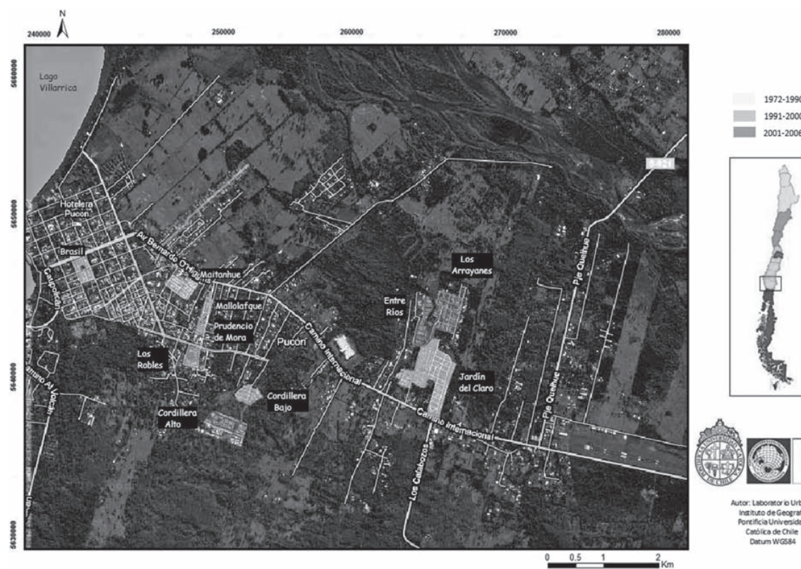
FIGURA 1. LOCALIZACIÓN DE LAS VIVIENDAS SOCIALES CONSTRUIDAS EN PUCÓN, 1972-2006 FIGURE 1. LOCATION OF SOCIAL HOUSING BUILT IN PUCÓN, 1972-2006

FUENTE: Elaboración propia en base a información obtenida de la Ilustre Municipalidad de Pucón, 2006 y Dirección de Obras Municipales, 2010.