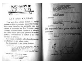
Imagen 9: Maílló, 1956:78-79