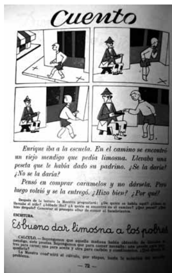
Imagen 8: Maílló, 1962:72