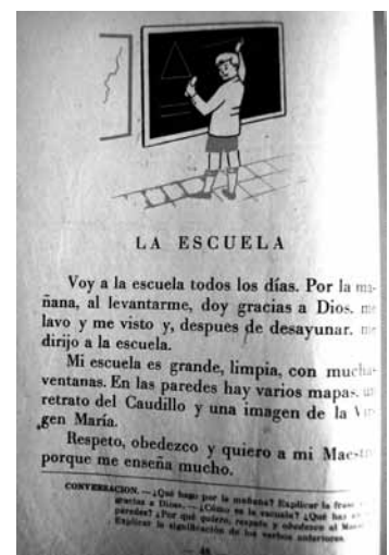
Imagen 7: Maíllo, 1956:48