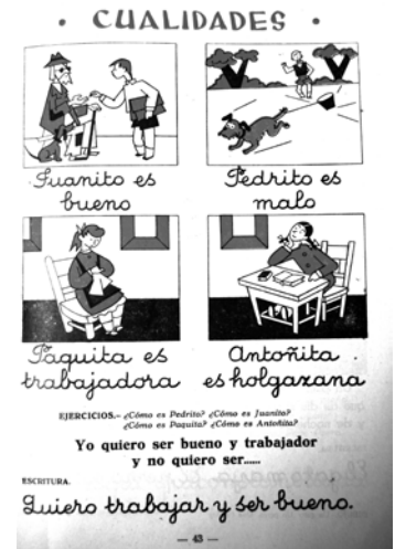
Imagen 5: Maíllo, 1962:43

Yo vivo en una casa. Todas las personas viven en casas, menos los mendigos, que no la tienen. Por eso me da mucha pena de los pobres. Cuando llueve mucho, pienso en los desgraciados que no tienen casa. En las noches de invierno, cuando silba el viento frío o cae la nieve, me acuerdo de los pobrecitos que no tienen casa y rezo para que Dios les ampare (ib.:28).