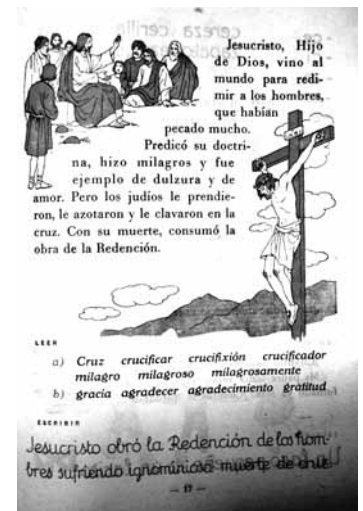
Imagen 2: Maillo, 1964:17

Resulta llamativa la historia de una niña que organiza una fiesta para bautizar a su muñeca (Maillo, 1961:11-12). Pero el más sugerente es, sin duda, el relato de «El Judío Convertido» de Cle-