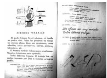
Imagen 6: Maíllo, 1956:96-97