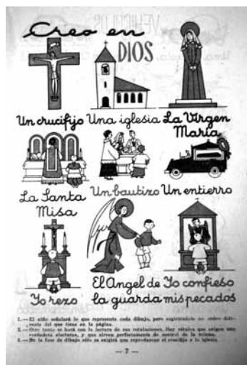
Imagen 1: Maílló, 1962:7