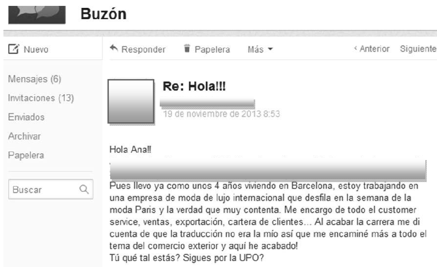
Imagen 2: Segundo ejemplo

En el segundo ejemplo, la egresada trabaja en una empresa internacional y se dedica a gestionar la cartera de clientes y la exportación. Ella no observa relación alguna entre la traducción y el comercio exterior.