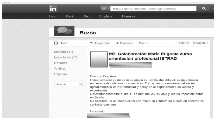
Imagen 1: Primer ejemplo

En los siguientes ejemplos, se refleja la autoconciencia de algunos egresados en Tel de la UPO que están trabajando en empresas españolas (o con sede en España) exportadoras de bienes y servicios. En los casos que presentamos, les habíamos escrito a antiguos alumnos para colaborar con un curso de orientación profesional, y lo que reproducimos aquí son algunas de las respuestas recibidas. Curiosamente, estos egresados pensaron que ellos no eran un buen ejemplo para futuros traductores.