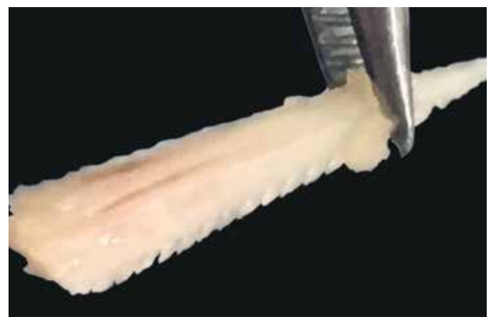
FIGURA 4: Ferrão da arraia. Detalhe para aspecto serrilhado visualizado à Usaf 22MHz