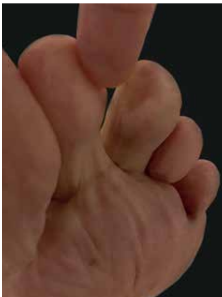
FIGURA 2: Terceiro pododáctilo esquerdo sem perda de solução de continuidade

O paciente foi submetido à retirada do CE (Figura 4) mediante a realização de pequena incisão na região plantar guiada pelo exame ultrassonográfico sob anestesia local. Foi administrado antibiótico sistêmico (cefadroxila, 500mg, 12/12 horas, durante sete dias), e o pós-operatório ocorreu sem intercorrências.