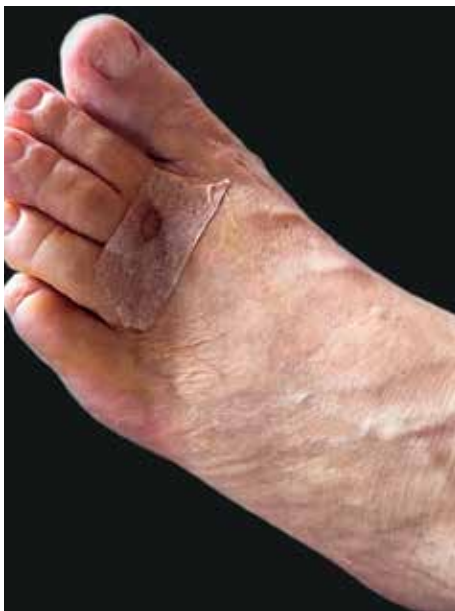
FIGURA 1: Dorso do pé esquerdo, após trauma ocasionado por arraia

O exame realizado na região plantar do pododáctilo em questão demonstrou a presença de estrutura hiperecogênica com formato triangular alongado, medindo 1,3cm no maior eixo, com um de seus lados apresentando estrutura linear e, o outro, com formato serrilhado (Figura 3).