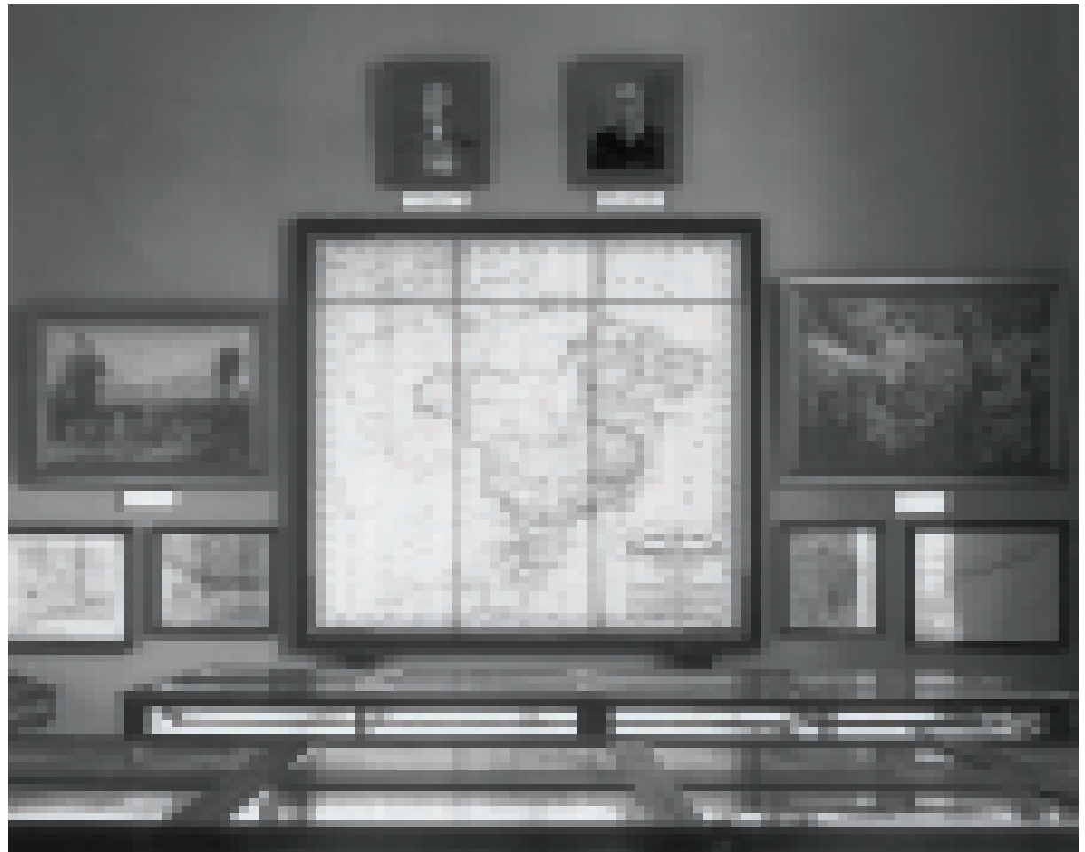
FIGURA 5 – Sala da Cartografia Colonial e Documentos Antigos, em exposição intitulada Iconografia Paulista, organizada por Afonso de E. Taunay, quando diretor do Museu Paulista (1917-1946), s/d., negativo de vidro.

outros. Em 1896 viajou para a Europa, onde permaneceu até 1899, tendo estudado na Académie Julien em Paris. Torna-se professor da ENBA em 1906, onde lecionou até sua morte. Rodolfo Amoedo (1857 — 1941). Nascido na Bahia, chegou em 1868 ao Rio de Janeiro, ingressando como aluno da Academia em 1874. Em 1879 viajou para Paris, como pensionista do Império, estudando na Académie Julien e na