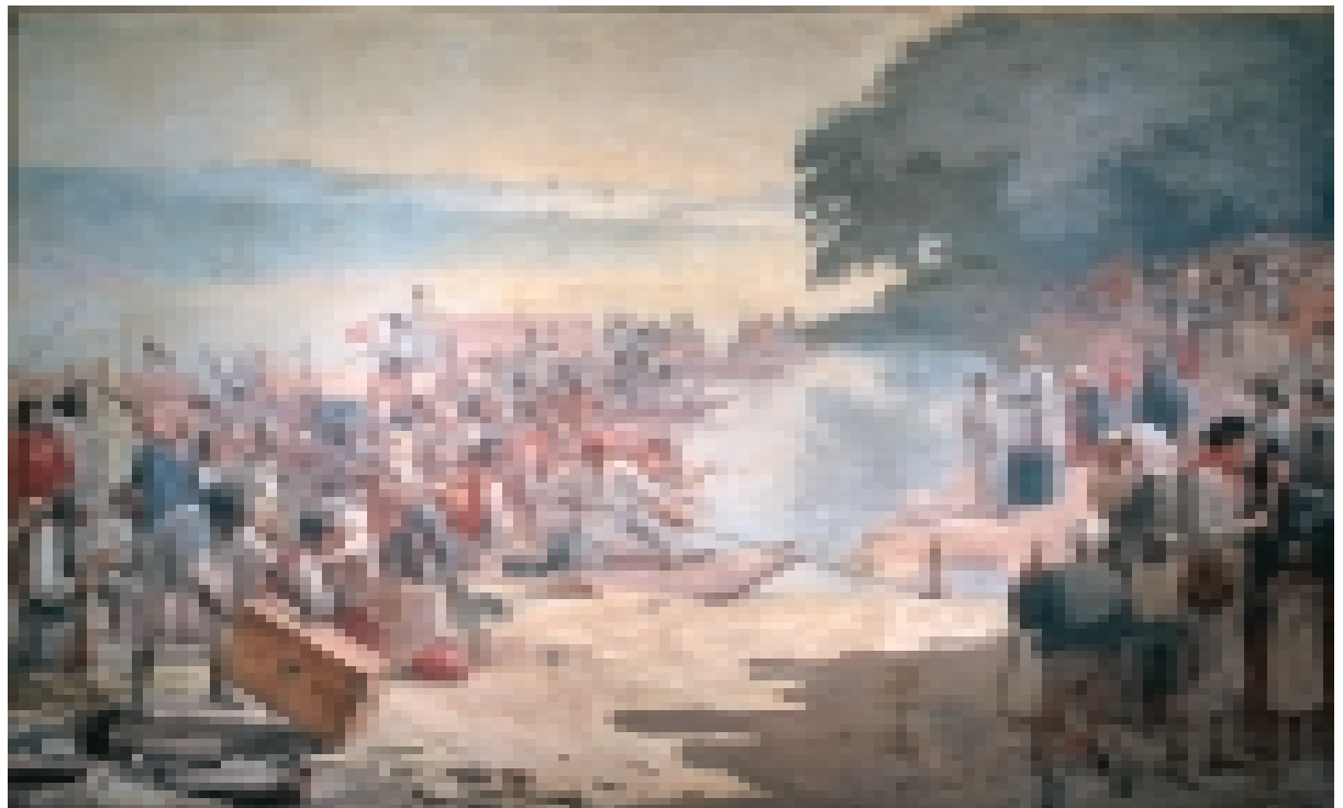
FIGURA 7 – Almeida Júnior. A Partida da Monção, 1897, óleo sobre tela, 390 x 640 cm, São Paulo. Inspirado em desenhos de Hercules Florence.