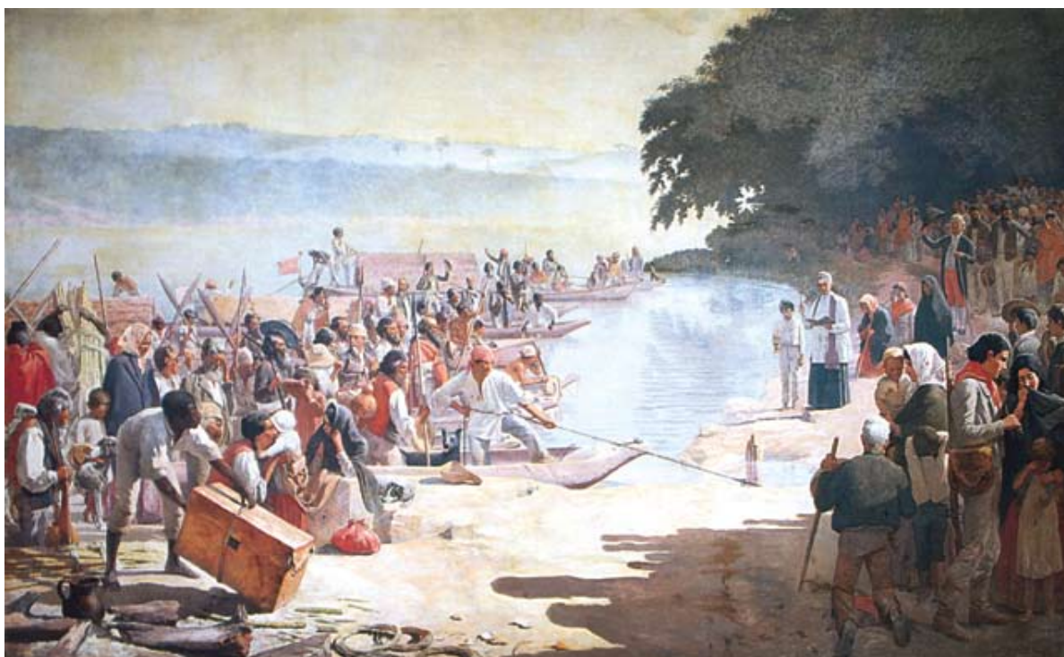
Figura 2 – A partida da Monção de José Ferraz de Almeida Júnior (1850-1899). Óleo sobre tela, 640 x 390cm. Acervo do Museu Paulista da USP.

Pai Nosso Pequenino Deus me leve em bom caminho Sete anjos me acompanha Sete velas me alumeia São Francisco é meu padrinho Santa Maria é minha madrinha Que me fez a cruz na testa Nada de mau me persiga Nem de noite nem de dia Nem no ponto do meio dia Nem na hora d'eu deitar Para sempre, Virgem Maria 17 .