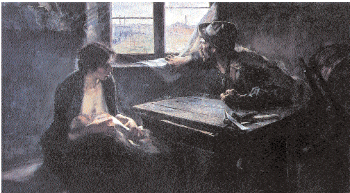
Figura 14 – Ernesto de la Cárcova, Sin pan y sin trabajo , 1892-1893, óleo sobre tela, 125,5cm x 216cm. Adquirido al artista en 1900, Acervo del Museo Nacional de Bellas Artes de Buenos Aires (MNBA).