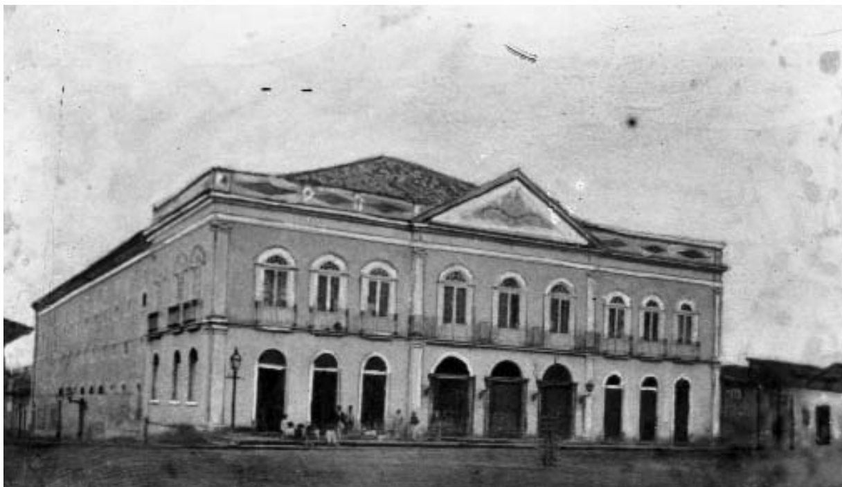
Figura 30 – Autoria desconhecida. Teatro de São José, c.1876, fotografia.