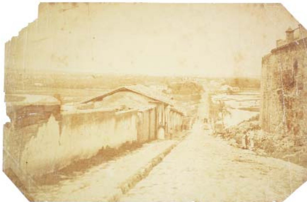
Figura 1 – Militão Augusto de Azevedo. Ladeira do Carmo, 1862/1863, fotografia.