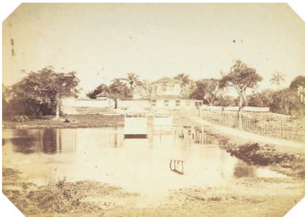
Figura 33 – Militão Augusto de Azevedo. Chácara Sharpe, 1862/1863, fotografia.