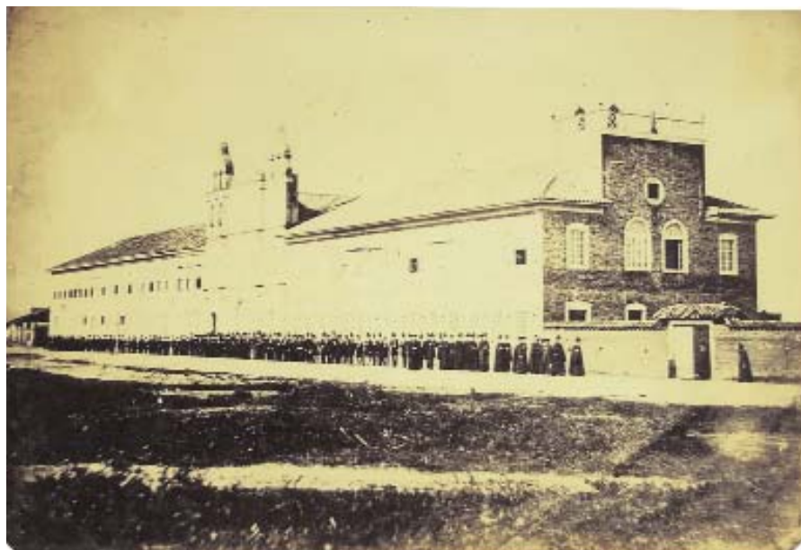
Figura 26 – Militão Augusto de Azevedo. Seminário Episcopal, 1862/1863, fotografia.

Os trabalhos de expansão do Seminário foram retomados com a construção do segundo lanço (1858-1860), que se projetava para o sul. Enquanto o primeiro, destinado aos alunos leigos, fora erguido conforme o sistema construtivo típico da região paulista, a taipa de pilão, o segundo, que abrigava os alunos devotados à vida clerical, encontrou condições favoráveis para que fosse executado de acordo com uma técnica construtiva que, naquele momento, começava timidamente a ser adotada: a alvenaria autoportante de tijolos (CAMPOS, 2004, p. 210). Não há, ao que se saiba, documentos escritos que comprovem o sistema construtivo empregado na parte nova do edifício. Mas as fotos tomadas do Seminário por Militão são contundentes a esse respeito. Ao ser fotografada, entre 1862 e 1863, a fachada do prédio ainda continuava despida de revestimento e isso nos possibilita verificar que nas paredes havia fiadas de tijolos de dois tons contrastantes, donde se conclui que ao menos dois fornecedores contribuíram para as obras dessa edificação. Por uma questão de coerência, a ala recente, na parte que olhava para a rua do Comércio da Luz (avenida Tiradentes), tinha a mesma aparência da primeira, erguida entre 1853 e 1856. Um longo sobrado, com largos beirais e sucessivas janelas retangulares, em cujos aros de madeira estavam grosseiramente talhados frontões de modesta inflexão neoclássica (CAMPOS, 2004, p. 210).