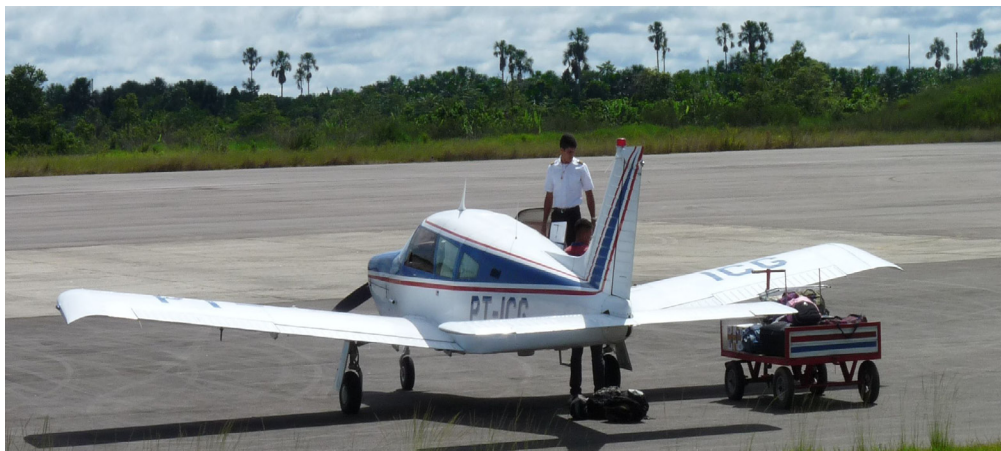
Figura 4 - Aeronave de empresa de Taxi-aereo estacionada no aeroporto de Eirunepé, fev 2012.