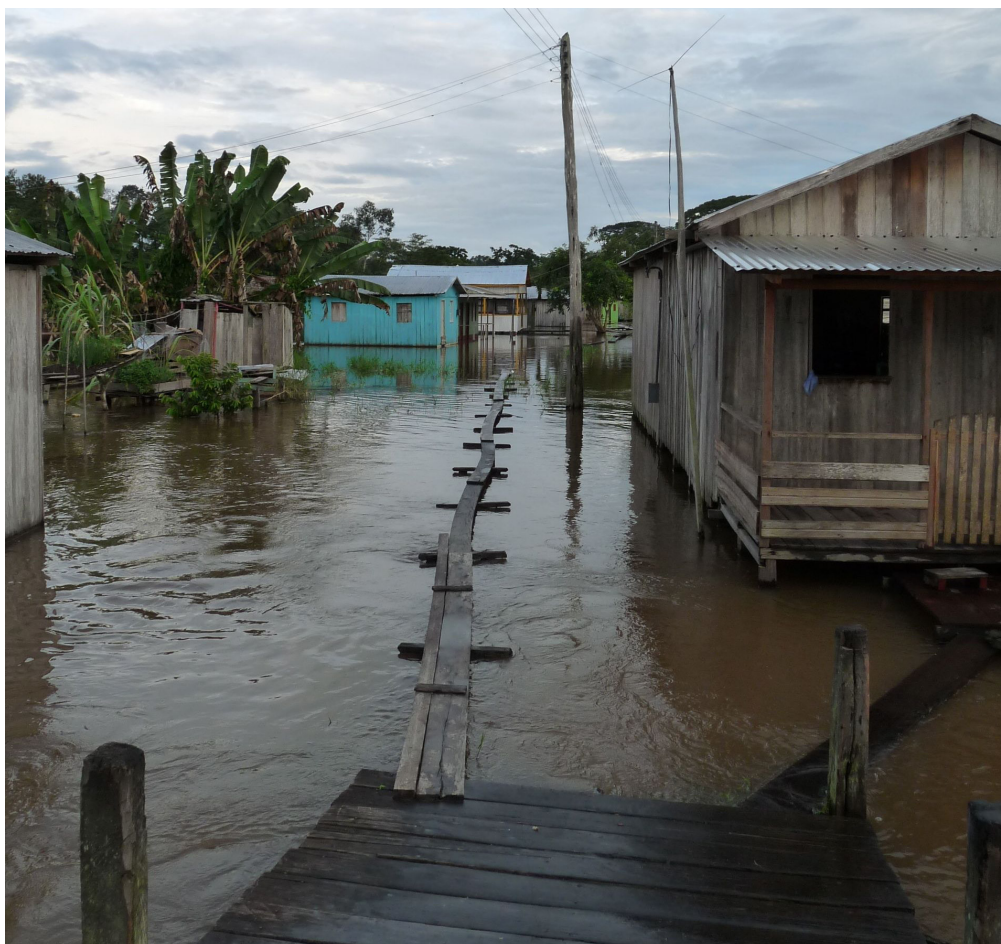
Figura 3 - Final do Morada do Sol e fundos de habitação na mesma area, fevereiro 2012

As diversas formas de hepatites são constante na cidade em especial a Hepatite A de veiculação hídrica, reflexo da falta de saneamento básico e uma conjunção de duas Hepatites virais a B e D. Estas estão presente em todos os bairros, porém em menor escala no Centro. A cidade no período das chuvas vive em cima de um charco e metade alagada e a falta de saneamento complica ainda mais a saúde pública.