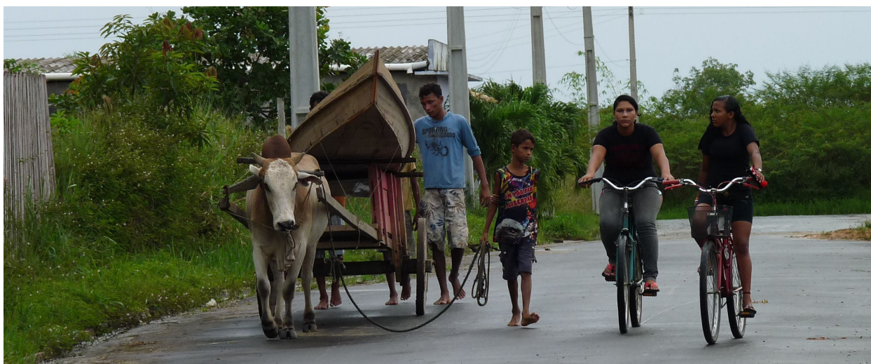
Figura 5 - Carro de boi, a bajola e as bicicletas: modais de transporte em Eirunepé.

dução rural das proximidades do núcleo urbano e da herança nordestina. Mas o interessante é que também são vistos carros de boi carregando canoas. Indicando a forte ligação do rural com o rio.