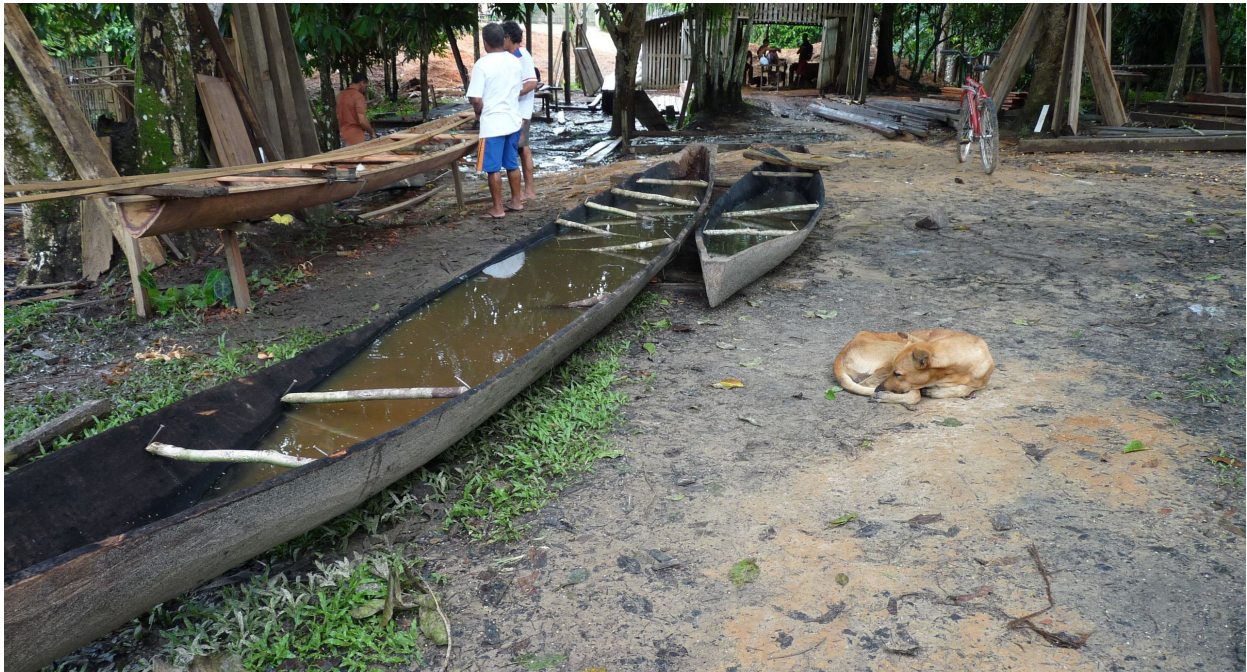
Figura 6 - Produção e reforma de canoas em Eirunepé. Fonte: Acervo Nepecab, fev/2012.

Além da Cooperativa do Marceneiros existe na cidade a Associação dos Pescadores, fundada em 1981, a dos Moto-taxistas de 1992, o Sindicato dos Trabalhadores em Educação em 1989 e a mais antiga a Associação dos Produtores Rurais de 1952. Todas localizadas no Centro ou bem próximo dele no bairro do Perpétuo Socorro.