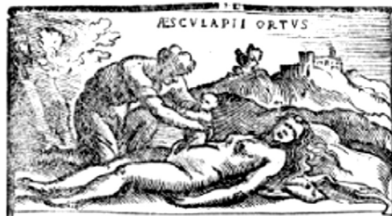
Extracción de Esculapio del vientre de su madre Coronis , por su padre Apolo . Relieve en madera de la edición « De Re Medica », de Alessandro Benedetti .

La vara de Esculapio , o sea una vara con una serpiente enroscada, apareció como emblema unos 800 años a.c., en tiempos de Homero . Según la mitología, Esculapio era hijo de Apolo y de Coronis ; ésta era hija de Flegias , rey de Tesalia . Encolerizado Apolo porque Coronis estaba enamorada del hijo de Eratos , cuando nació su hijo lo dejó abandonado en el Monte Titón , donde una cabra cuidaba de su nutrición y un perro de su seguridad. Un pastor encontró al niño y lo entregó al cuidado del centauro Girón , quien le enseñó la medicina y a partir de ahí sus poderes curativos se vuelven famosos en todo el país.