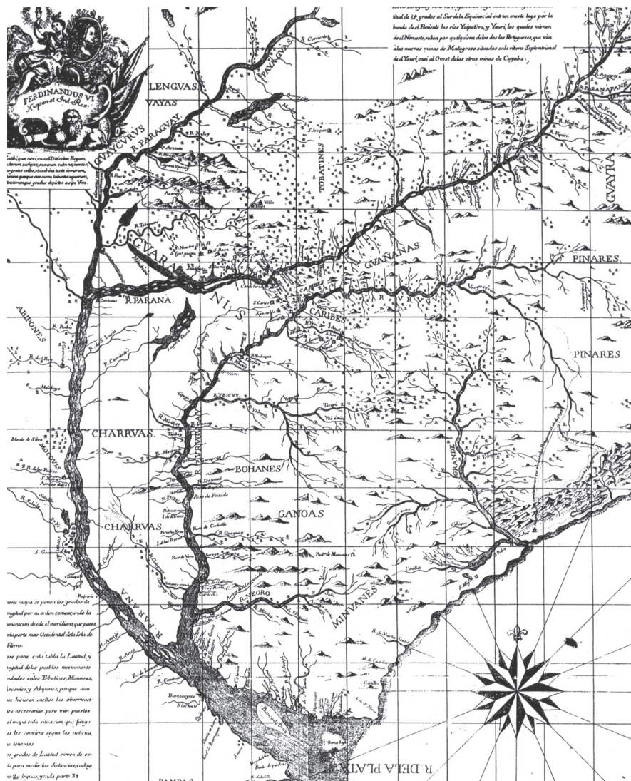
MAPA 1. CUENCA DEL RÍO DE LA PLATA ENTRE 1760 Y 1860