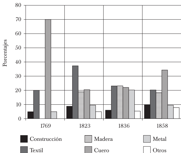
GRÁFICA 2. EVOLUCIÓN DEL SECTOR SECUNDARIO EN MONTEVIDEO, 1769-1858