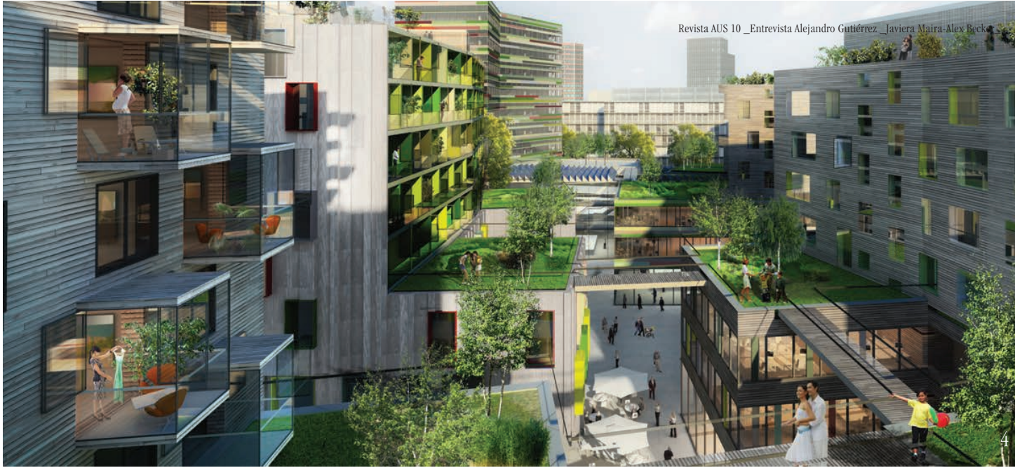
Imagen 4_Low2No en Helsinki.