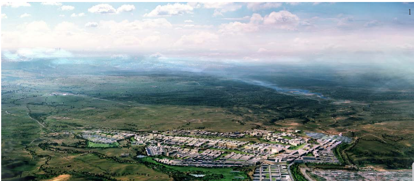
Imagen 1_Ciudad del conocimiento, Madrid.

Es un ejercicio de balance muy complejo, en el cual se van articulando diversos niveles de agentes. En principio siempre tiene que ver con que sea sostenible en el sentido más amplio de la palabra. Sostenible quiere decir que sea durable en el tiempo, y para que esto ocurra, tiene que ser algo que no solamente sea eficiente desde el punto de vista energético, del uso de los materiales, lo ambiental, lo global, considerar el tema del agua, la energía, sino también que sea eficiente en el sentido de la comunidad que usa ese edificio, la que se afecta positiva o negativamente con él, que las personas se sientan dueñas de ese lugar. Si yo quiero que algo dure, eso tiene que ser querido. Tiene que ver con el tema obviamente estético, cuando una cosa no es aceptada por la mayoría de las personas de una comunidad porque no tiene calidad ni valor estético ni genera impactos positivos, es una mala señal. Se relaciona con cómo envejecen las cosas, el tema de los materiales es muy importante, sea en espacios públicos o en edificios, porque a largo plazo son inversiones que tienen distinta duración.