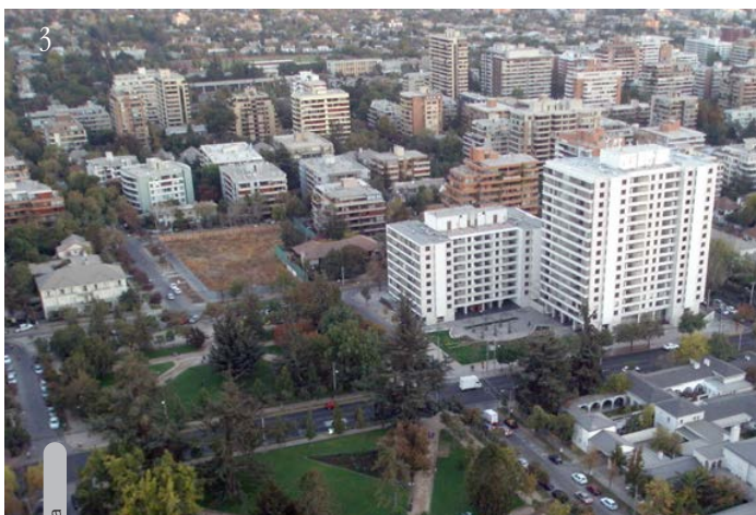
Imagen 2_Stratford City, parte de la ciudad olímpica para Londres 2012 (fuente: Arup). Imagen 3_Plaza de Las Lilas en Santiago de Chile (fuente: Diario La Tercera).