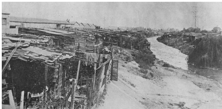
Imagen 2. Poblaciones callampas.