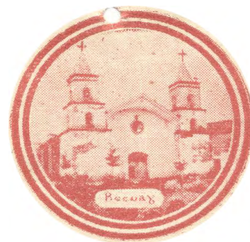
Imagen 6. Iglesia de San Ildefonso de Recuay.

El terremoto castigó también a Aija, la iglesia fue muy afectada. El organismo de reconstrucción del Estado pretendía demolerla, pero los fieles se opusieron. En el lado izquierdo, la iglesia tuvo una torre original de tres cuerpos y una cúspide. Hacia 1955 fue construida la otra torre, semejante a la anterior (imagen 8). En 1974 se iniciaron las acciones de restauración y se incorporó la torre actual (imagen 9).