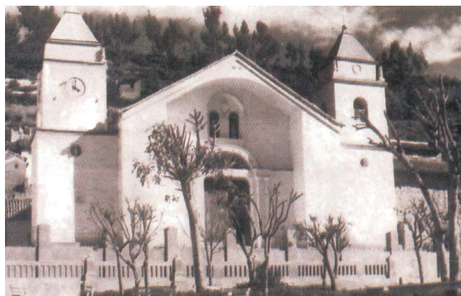
Imagen 8. Iglesia de San Santiago de Aija (fuente: González Quijano, 2009).