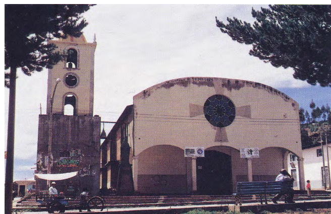
Imagen 7. Iglesia de San Ildefonso de Recuay. Estado actual.

“Algunos candidatos a la Municipalidad Provincial de Huarás quieren colgarse de la imagen de la catedral.”