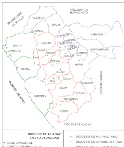
Imagen 2. Diócesis de Huarás en la actualidad (fuente: Velásquez, J. [2000] Diócesis de Huarás. Cien años de vida diocesana . Lima: Pacific Press).

MÉTODO. Las categorías nos traen la síntesis de una diversidad: la síntesis del entendimiento acontece por su mediación. Así, como primer paso, definí las categorías de análisis: discursos, imágenes y acciones. Como segundo paso, delimité el área de estudio (ver imágenes 1 y 2): Huarás, Recuay y Aija (Ancash, Perú). Esta área está a punto de ver concluida la obra nueva de la catedral de Huarás, pues la antigua catedral fue demolida después del terremoto de 1970. La Cordillera de los Andes marca el territorio ancashino, trazando su relieve con todos sus imprevistos accidentes. El lugar de los ramales que se bifurcan se alza, se hunde, recorre cumbres y abismos sonoros. La Cordillera Blanca -macizos gigantes de más