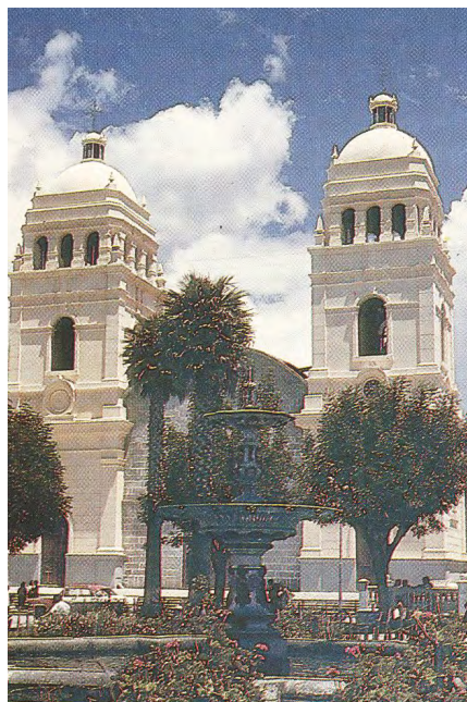
Imagen 5. Catedral de Huarás antes del sismo de 1970