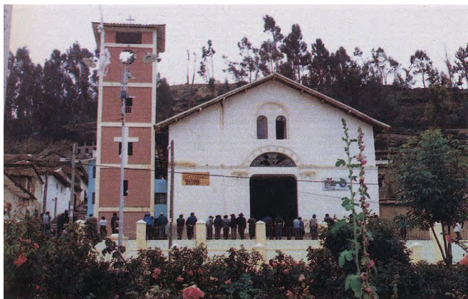
Imagen 9. Iglesia Matriz de San Santiago de Aija. Estado actual.