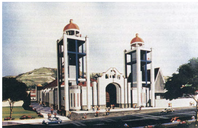
Imagen 10. Catedral de Huarás. Perspectiva.

DISCUSIÓN. Aquellos que hacen discursos, no son la masa, pero dicen ser su portavoz. Los mediadores compiten por ser quienes la expresen. Dan la impresión de que solo la analizan y aclaran, sin embargo, deforman los valores que los hombres confieren al universo. Cada discurso presenta una sesgada versión del mundo, pues dice más de la visión del mundo que tiene un mediador, que del mundo mismo. Lo que define el periodo 1561 - 1673 es la dirección de autoridades religiosas, quienes presentan a la conciencia colectiva una imagen de sociedad. La religión es el espacio donde se forman los grandes discursos del mundo, donde el mundo se hace -es hecho- inteligible. Plantea pautas de comportamiento, actitudes - predisposiciones- de cómo actuar frente a lo mundano.