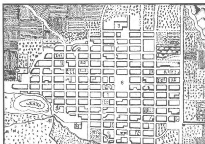
Imagen 4. Pueblo de Huarás, 1782 (fuente: Varón, 1980).