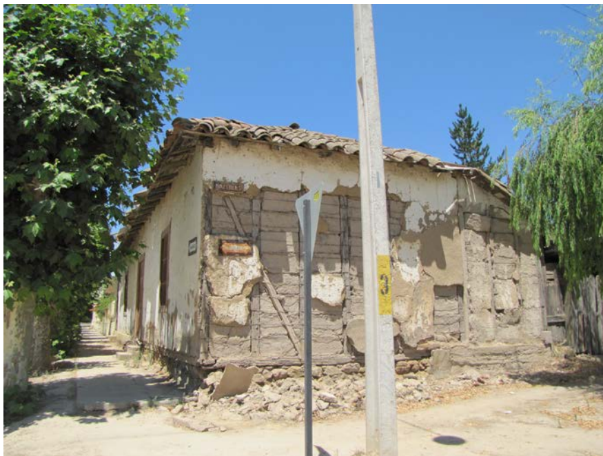
Imagen 1. Vulnerabilidad en los territorios.