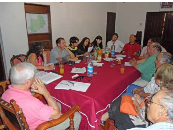
Imagen 3. Validación de decisiones.