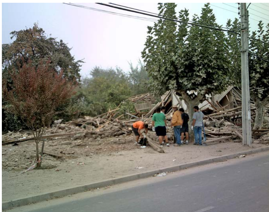
Imagen 2. Optimizar las políticas sociales en el territorio.

En Latinoamérica el concepto de vulnerabilidad inicialmente se relaciona a definiciones de vulnerabilidad social desde enfoques de carencia de poder y privación de derechos humanos (Busso 2001); otros se conectan con los conceptos de ‘pobreza’ y ‘niveles socioeconómicos’; y para algunos autores la vulnerabilidad social explica la incapacidad de los grupos más débiles de la sociedad para enfrentar el modelo económico neoliberal vigente (Pizarro 2001). Actualmente, los países latinoamericanos están atravesando intensas transformaciones en el marco de los procesos de globalización, con reestructuración económica que comprende reformas de los Estados, apertura del mercado financiero, incremento de la tercerización, entre otros. Junto a esto, se ha producido un cambio en el tipo de desarrollo social; hay aceptación de la desigualdad y “la noción de igualdad ha sido reemplazada por la de equidad (que es una parte de la igualdad), la agenda social se ha fraccionado y se ha ampliado para contemplar temas como la extrema pobreza, la equidad de género, de raza, de etnia, entre otros” (Kaztman 2003). Es así que en Latinoamérica también se incorpora y estudia el concepto de ‘Manejo Social de Riesgo’, cuyo enfoque nace en la década del 90 en el Banco Mundial, entendiéndose por riesgo la vulnerabilidad que las personas, las comunidades y los territorios tienen para