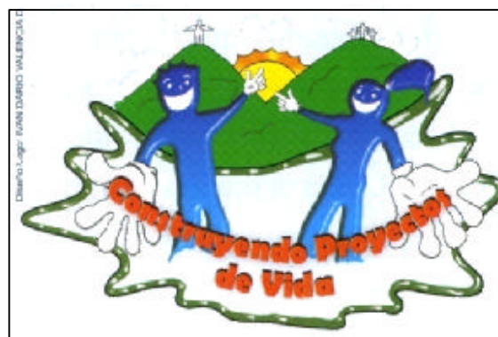
Figura 2. Logotipo ganador del concurso realizado por los SAJ, Zona Ladera, PCFM Cali, 2007