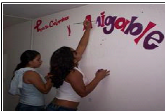
Figura 1. Jóvenes de la zona de ladera pintando un mural del consultorio para los SAJ