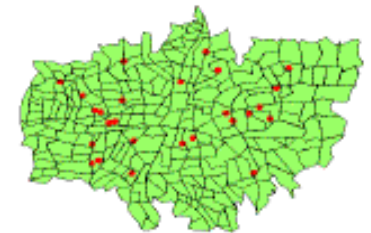
Figura 2. Muertes por accidentes de tránsito según barrio. Medellín 1992-1996

Sexo y asociación con formas de morir. Se estimó la relación entre el sexo y las causas de muerte ajustado