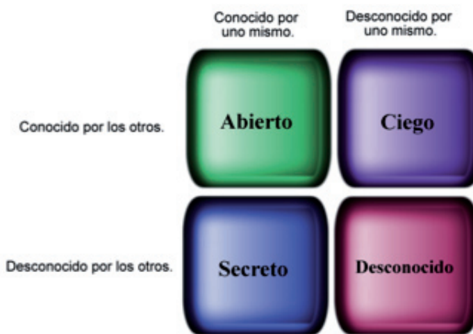
Figura 1. Ventana de Johari