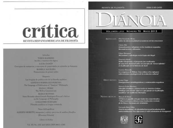
Revistas del Instituto de Investigaciones Filosóficas

Sobre el particular es oportuno destacar que el acervo se ha visto enriquecido con las donaciones de libros y archivos de figuras prominentes de la Filosofía como José Gaos, Alfonso Reyes, Eduardo García Máynez, Samuel Ramos y Alejandro Rossi. 5