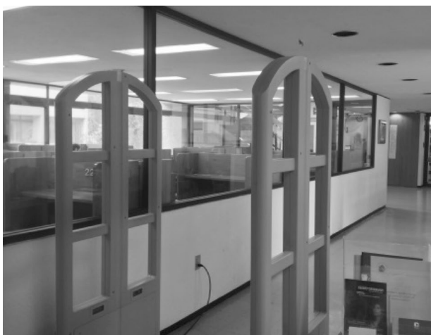
Entrada de la Biblioteca Eduardo García Máynez

El organigrama de la Biblioteca comprende una Coordinación y cuatro secciones: Desarrollo de Colecciones y de Cómputo, Colecciones Especiales, Hemeroteca y Bibliografía Filosófica Mexicana y Archivos.