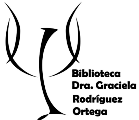
Logotipo de la Biblioteca.

el 20 de mayo de 2013, en su 5 a sesión, la Comisión de Biblioteca aprobó el logotipo de la Biblioteca.