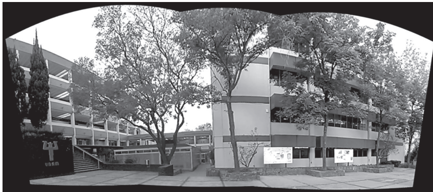
Biblioteca de la Facultad de Psicología. Enero de 2015.

El acervo de la Biblioteca “Dra. Graciela Rodríguez Ortega” de la Facultad de Psicología tiene su antecedente más reciente en la Biblioteca “Samuel Ramos”, de donde se desprendió como colección independiente el 27 febrero del año 1973, 1 cuando el Consejo Universitario aprobó la creación de la Facultad de Psicología; sin embargo, su origen es más antiguo ya que la psicología formó parte de la Sección de Humanidades con que inició la Escuela Nacional de Altos Estudios, según registra la Ley Constitutiva de la escuela (abril 7 de 1910), 2 y como área se estableció en el plan de estudios de 1939 de la entonces creada Facultad de Filosofía y Letras, en la que formalmente se organizó como carrera hasta 1944.