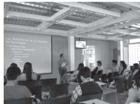
Usuarios de nuevo ingreso 2013 recibiendo la plática sobre los recursos de información de la UNAM.