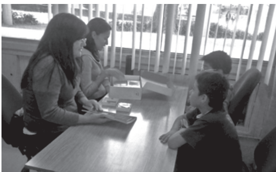
Sala de Pruebas Psicológicas. Alumnas aplicando pruebas psicológicas.

La Biblioteca abre sus puertas de lunes a viernes de las 8:30 de la mañana a las 20:00 hrs. y al menos diez sábados por semestre con horario de 9:00 a 14:30 hrs., proporcionando los servicios tradicionales de préstamo en sala, a domicilio e interbibliotecario, a lo que se añaden algunos servicios complementarios, como: el préstamo de pruebas psicológicas; el uso de catálogos locales; el acceso en toda la Biblioteca a la RIU (Red Inalámbrica Universitaria); la orientación y difusión de información vía solicitudes por Internet, teléfono y en persona; el servicio de reprografía en las modalidades de autoservicio y concesionado; los servicios de información especializada (elaboración de bibliografías y búsqueda de información, etcétera); los cursos de búsqueda de datos y biblioteca digital; la instrucción colectiva a usuarios de nuevo ingreso; las visitas guiadas a alumnos de bachillerato, padres de familia y estudiantes de otras instituciones; y actividades de difusión cultural.