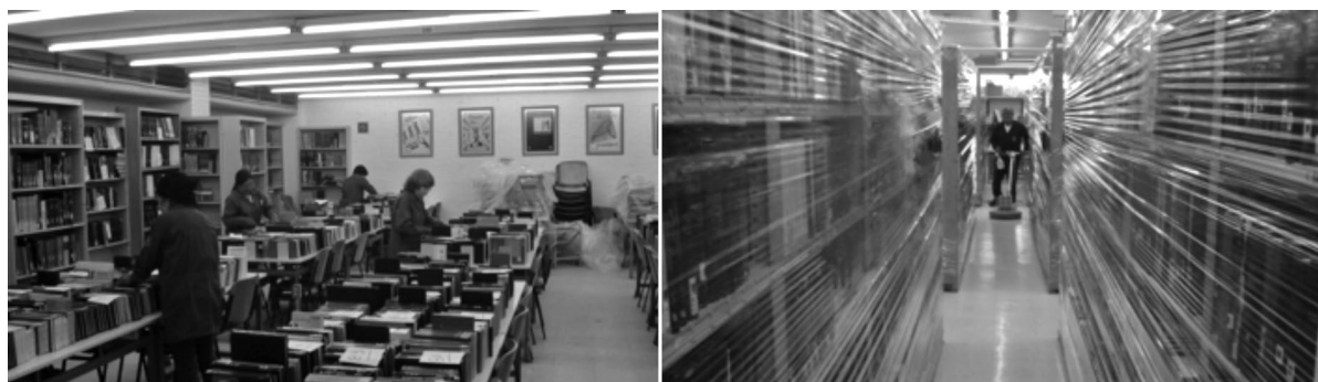
Limpieza profunda anual del acervo.

la Sala de Proyección Audiovisual, con 16 y 20 lugares respectivamente para usuarios.