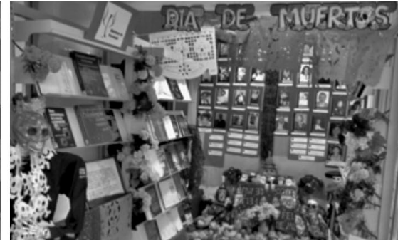
Exposiciones: Izquierda "Los mandamientos del buen lector" y derecha "Ofrenda de día de muertos".