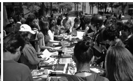
Maratón de lectura (izquierda) y mesa de regalos (derecha) en el marco de la Celebración del Día Mundial del Libro y del Derecho de Autor 2014.