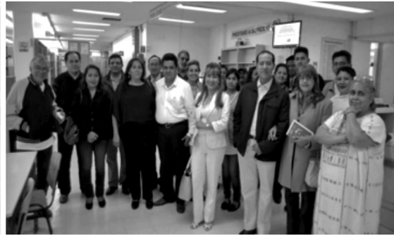
Izquierda: Visitas guiadas para alumnos de bachillerato. Derecha: Visitas guiadas a padres de familia.