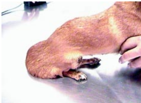
Figura 1. Animal apresentando hiperextensibilidade cutânea na região posterior.

À microscopia de luz observou-se edema, hiperemia, infiltrado inflamatório moderado e difuso no qual foi possível constatar diminuição do número de fibras colágenas na derme, que apresentavam aspecto fibrilar notando-se raros feixes de fibras com acentuada fragmentação (seta). HE 400x.