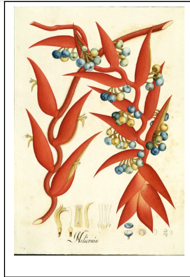
Figura 1 – Heliconia. Digitalización de los dibujos de la Real Expedición Botánica del Nuevo Reino de Granada (1783-1816).