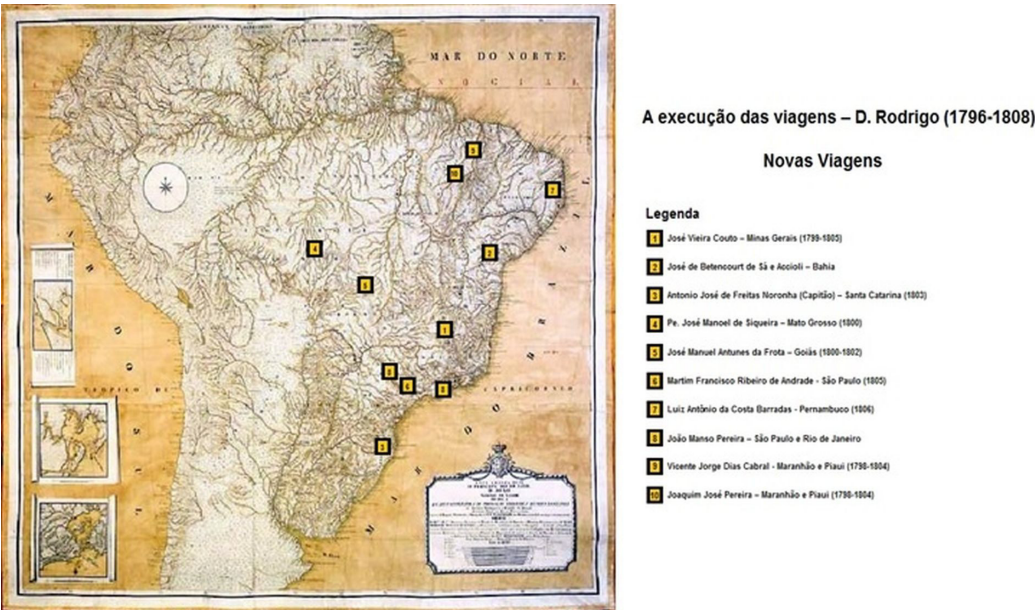
Figura 2: Regiões percorridas pelos viajantes na administração de D. Rodrigo de Souza Coutinho (1796-1805).