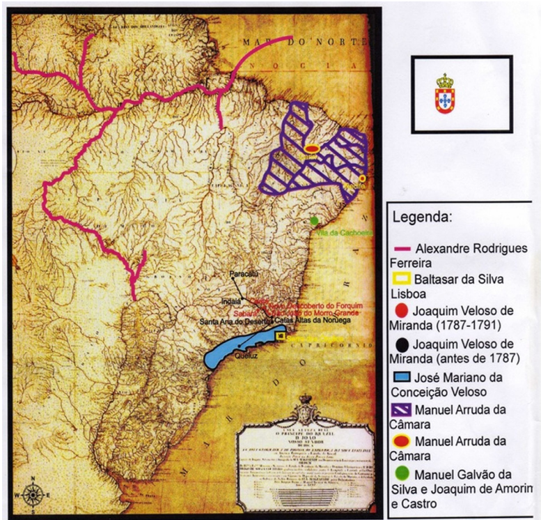
Figura 1: Mapa demonstrativo dos percursos dos viajantes durante a administração de Martinho de Melo e Castro (1777-1795).