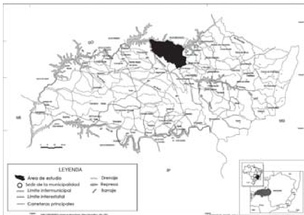
Figura N° 1 Ubicación de la cuenca en el mapa de Brasil

La cuenca del arroyo Piçarrão, que ocupa un área de 388 km 2 , se localiza en el municipio de Araguari, entre las coordenadas geográficas 18° 37' 53" y 18° 53' 04" de latitud Sur y 47° 44' 44" y 48° 07' 12" de longitud Oeste.