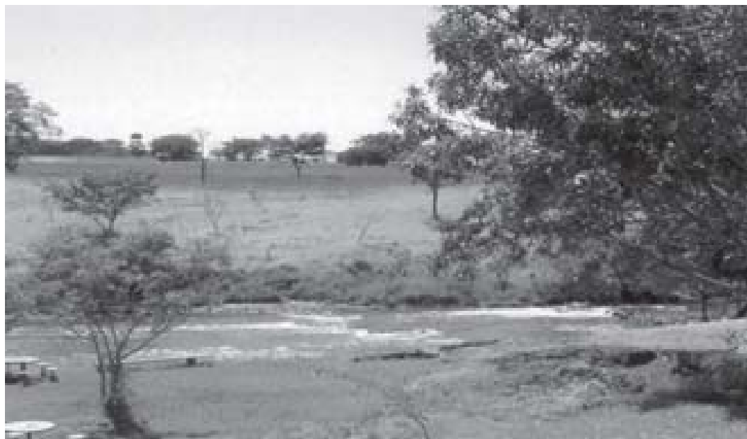
Figura N° 4 Espacios de ocio en la cuenca