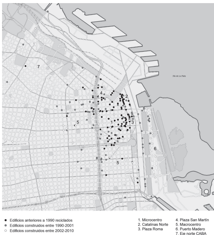
Figura N° 4 Distribución territorial de edificios A y A+ entre 1990-2010 en la RMBA. Detalle del área central de la CABA