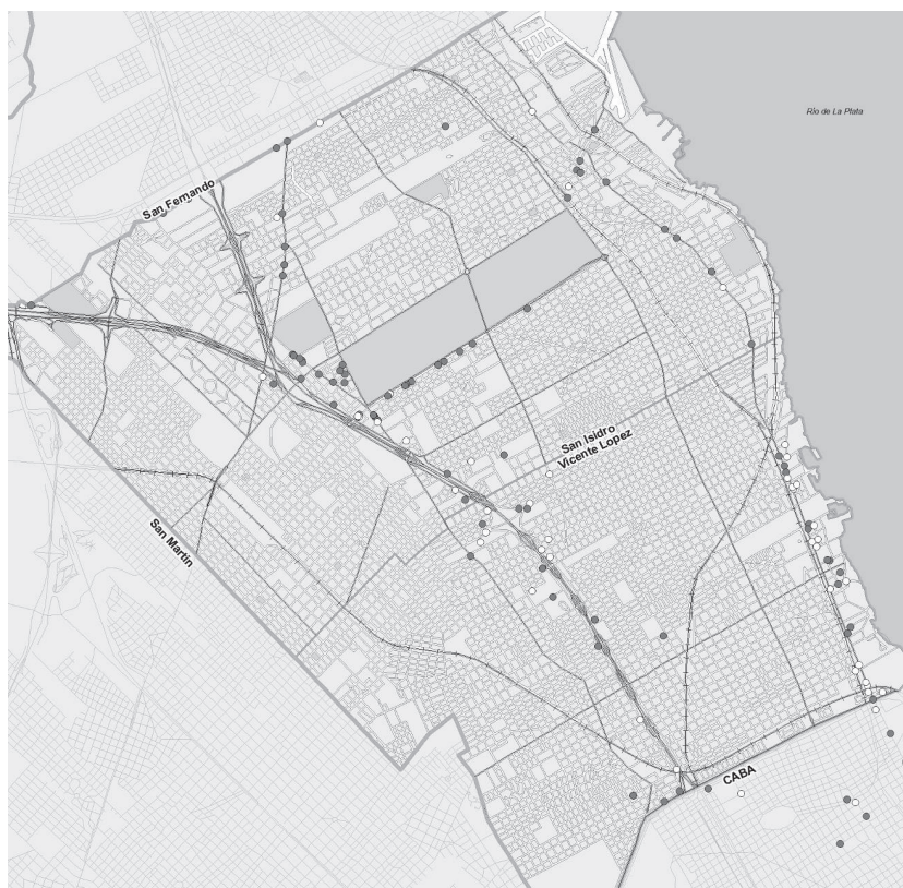
Figura N° 5 Distribución territorial de edificios A y A+ entre 1990-2010 en la RMBA. Detalle de los partidos de Vicente López y San Isidro