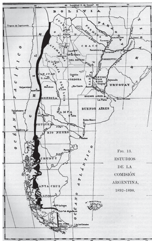
Fig. 13. ESTUDIOS DE LA COMISIÓN ARGENTINA, 1892-1898.

Fuente: Argentina. Oficina de Límites, 1902.