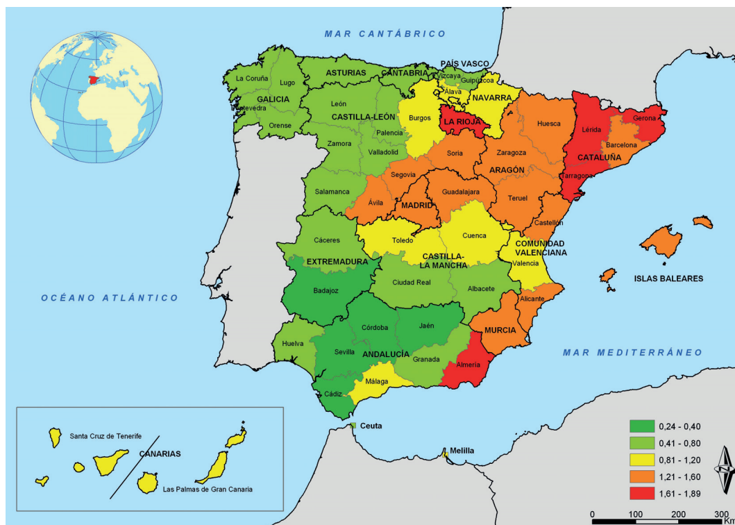
Figura Nº 3 Coeficiente de localización del alumnado extranjero en el curso 2011-2012

Fuente: Elaboración propia basado en datos del Ministerio de Educación, Cultura y Deporte (Gobierno de España).