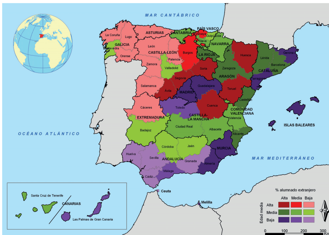
Figura Nº 6 Relación entre edad media de población y alumnado extranjero, curso 2011-2012

Fuente: Elaboración propia basado en datos de INE, Padrón de habitantes y Ministerio de Educación, Cultura y Deporte (Gobierno de España).