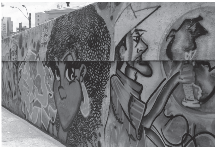
Foto 1. Grafite com elementos do movimento Hip hop.