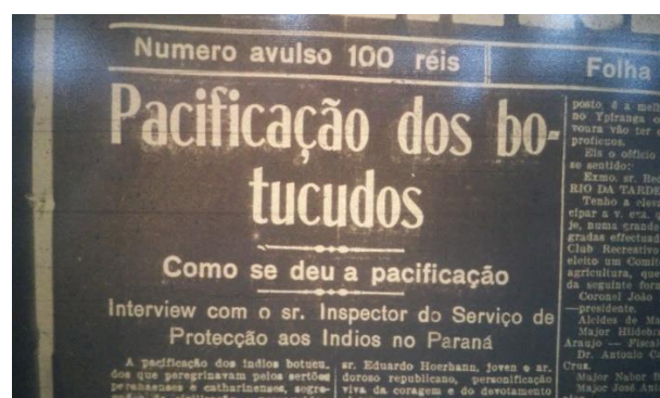
Fonte: O Diário da Tarde, 26 de outubro de 1914.